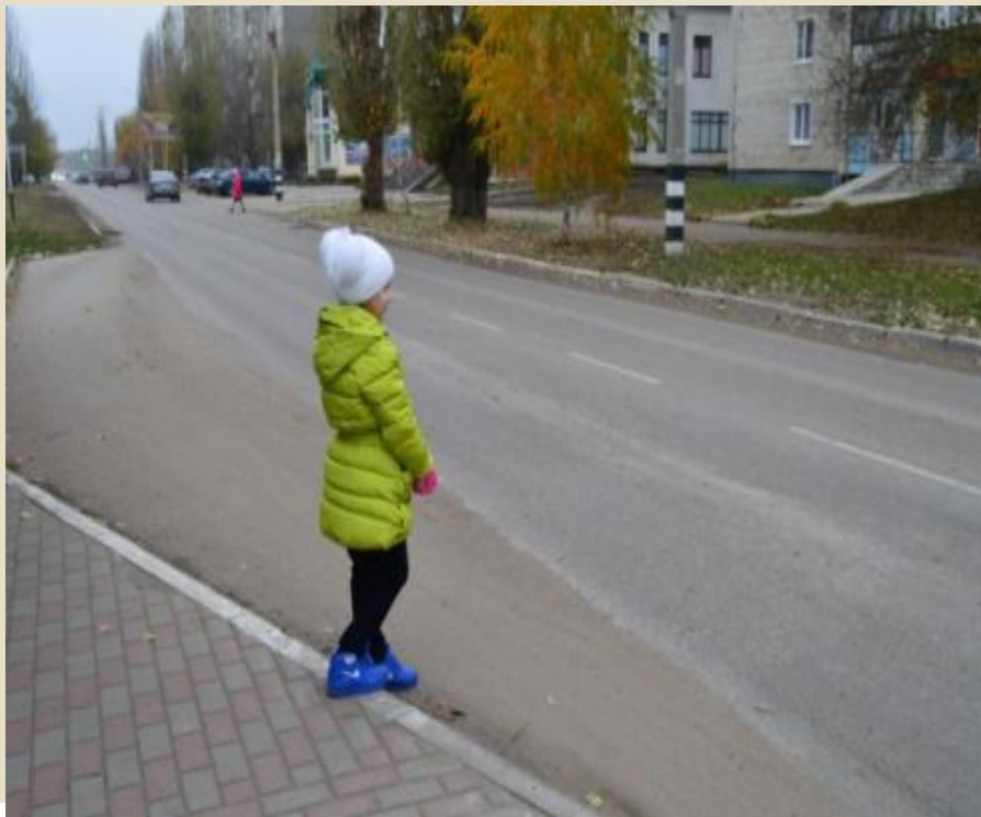
Фото-Кейс: «Как правильно переходить улицу»

Текст: Мама отправила Машу в магазин за хлебом. Магазин находится через дорогу от дома Маши, а до пешеходного перехода идти далеко.