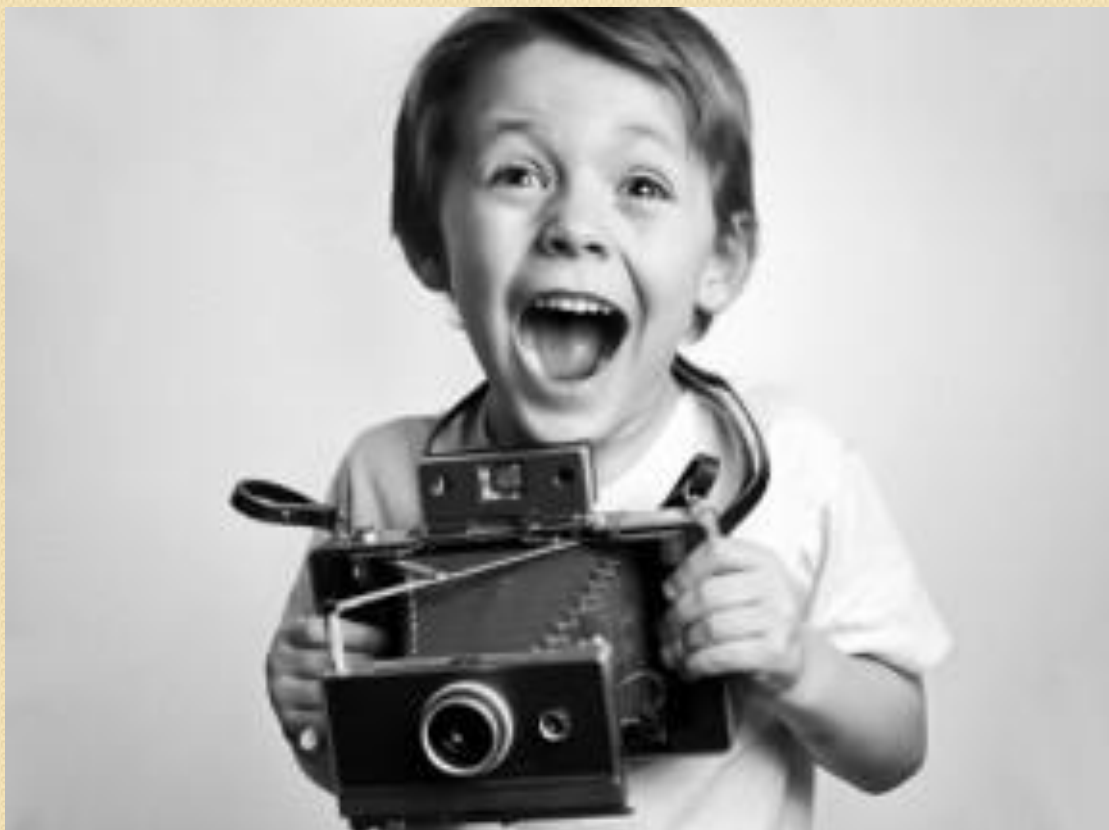
Фото-кейс активизируют мысль детей, развивают воображение, потребность в общении с другими людьми, воспитывают чувства. А иллюстрация с продолжением мотивирует интерес детей.