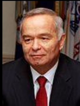
Іслам Абдуганієвич Карімов (нинішній президент)

Згідно з Конституцією(8 грудня 1992), Узбекистан — правова демократична держава. Глава держави — президент