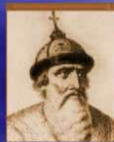
Владимир Мономах (1113-1125)