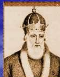
Владимир Красное Солнышко (Святой) (980-1054)