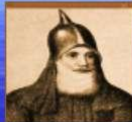
Рюрик (Новгород) 862-879