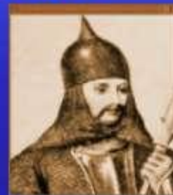
Олег Вещий (Киевская Русь) 912-945