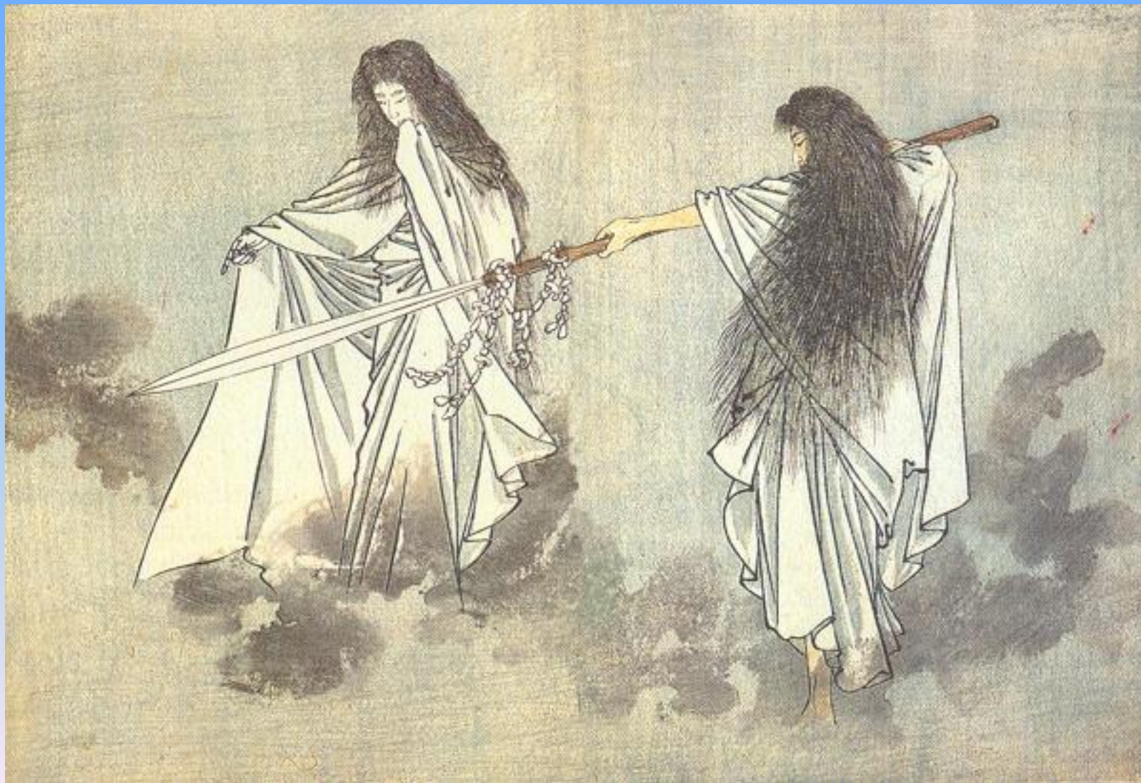
Идзанаги и Идзанами, боги- предки

Творение изображалось как «добывание» героем элементов культуры или как превращение хаоса в космос путем постепенного упорядочения.