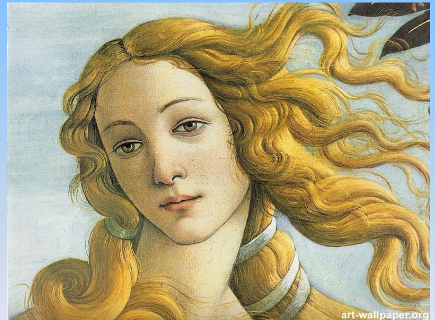
Боттичелли «Рождение Венеры»