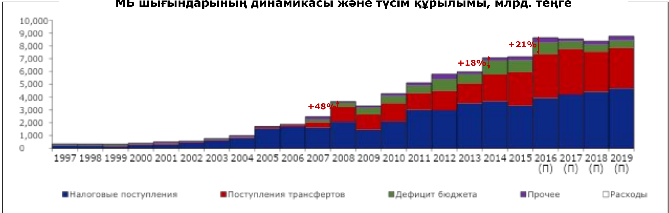
МБ шығындарының динамикасы және түсім құрылымы, млрд. теңге