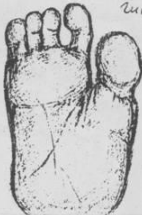
Человек (по Швайбелю)