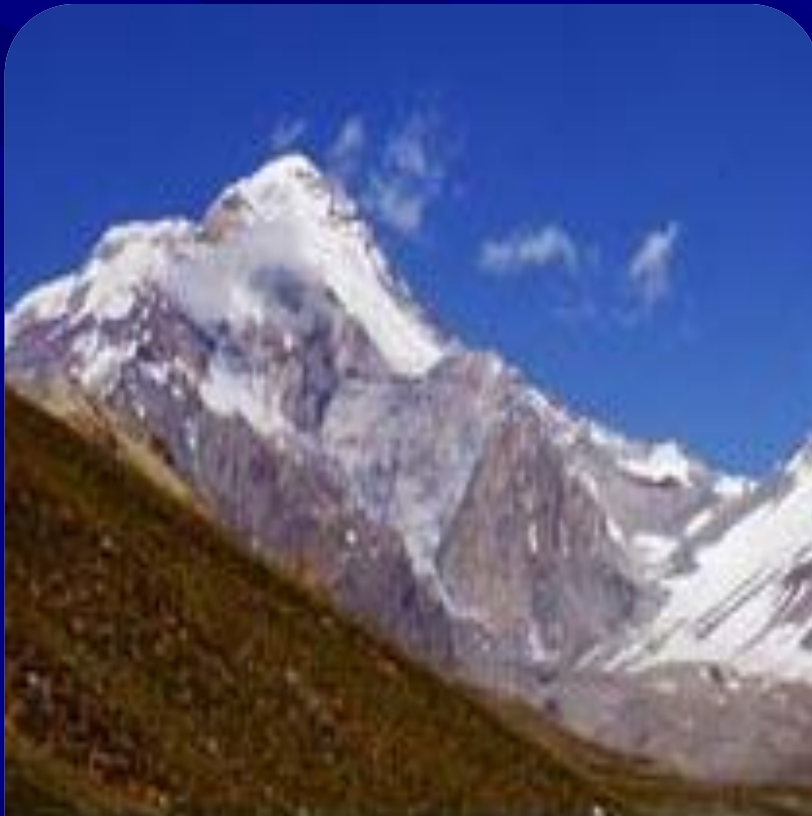
Аконкагуа 6960 м