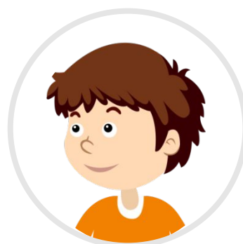
застрахованное лицо Ребенок