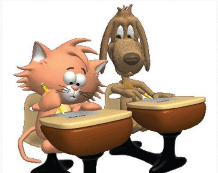
ГРАФИК УЧАСТИЯ В МЕРОПРИЯТИЯХ