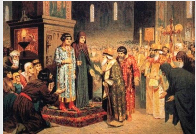
Избрание Михаила на царство