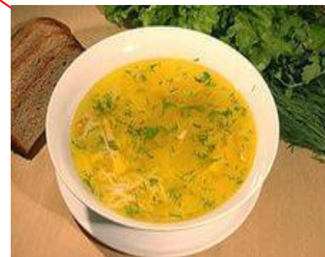
Суп с вермишелью