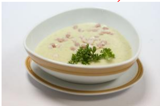
Грибной суп -пюре