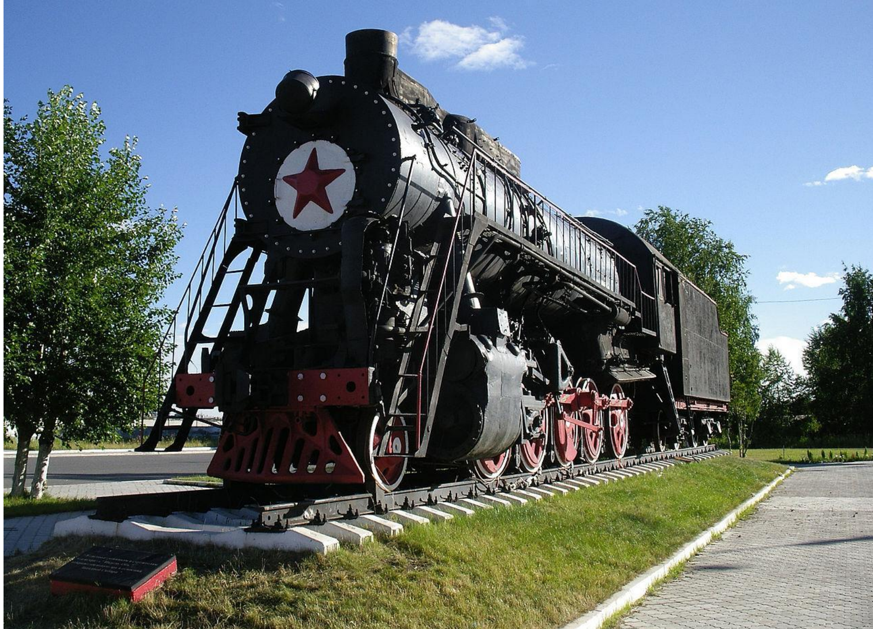
Памятник строителям железнодорожной линии Ивдель