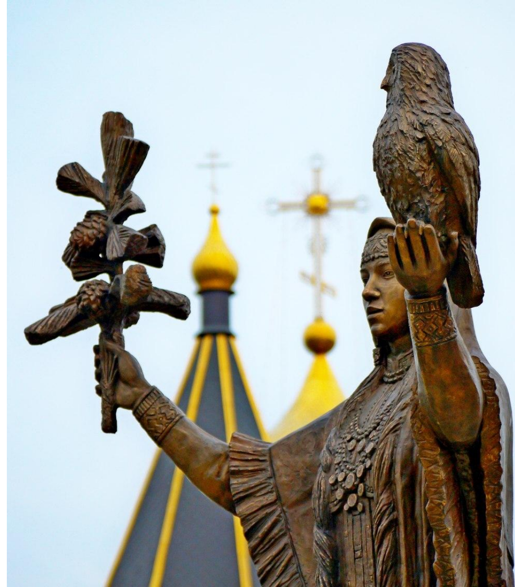
Памятник Скульптура Югорская берегиня