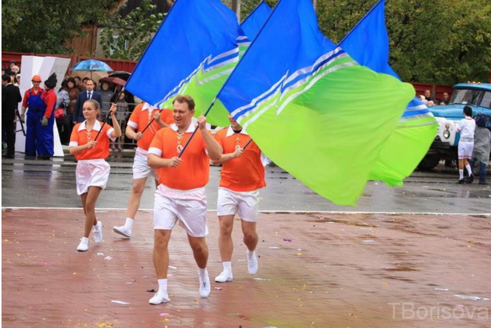
Флаг города Югорска