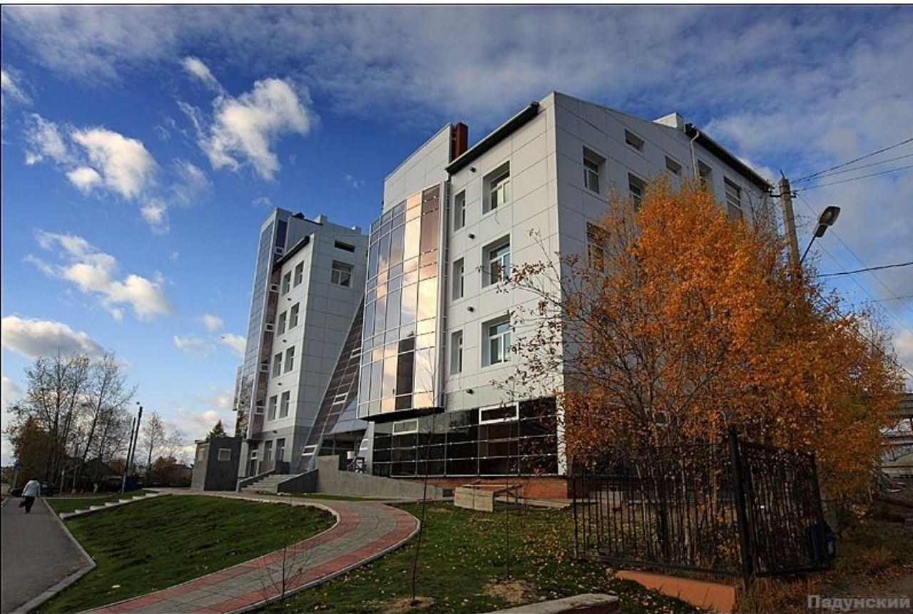
Здание городской больницы