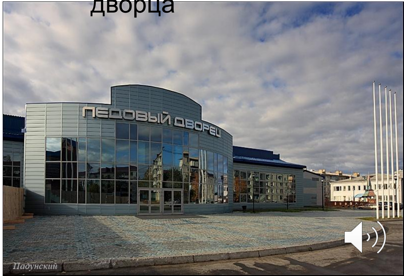
Здание Ледового дворца