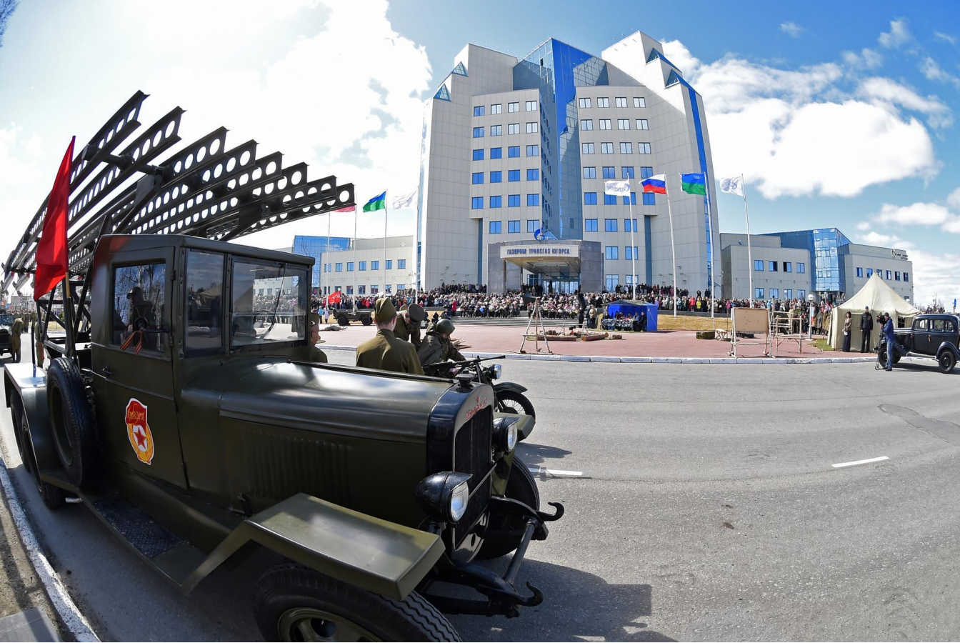
Парад победы в Югорске