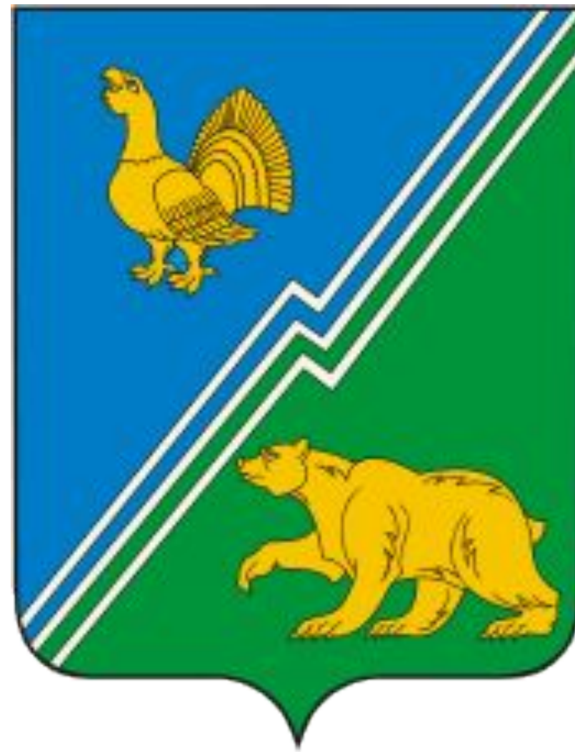
Новый герб города