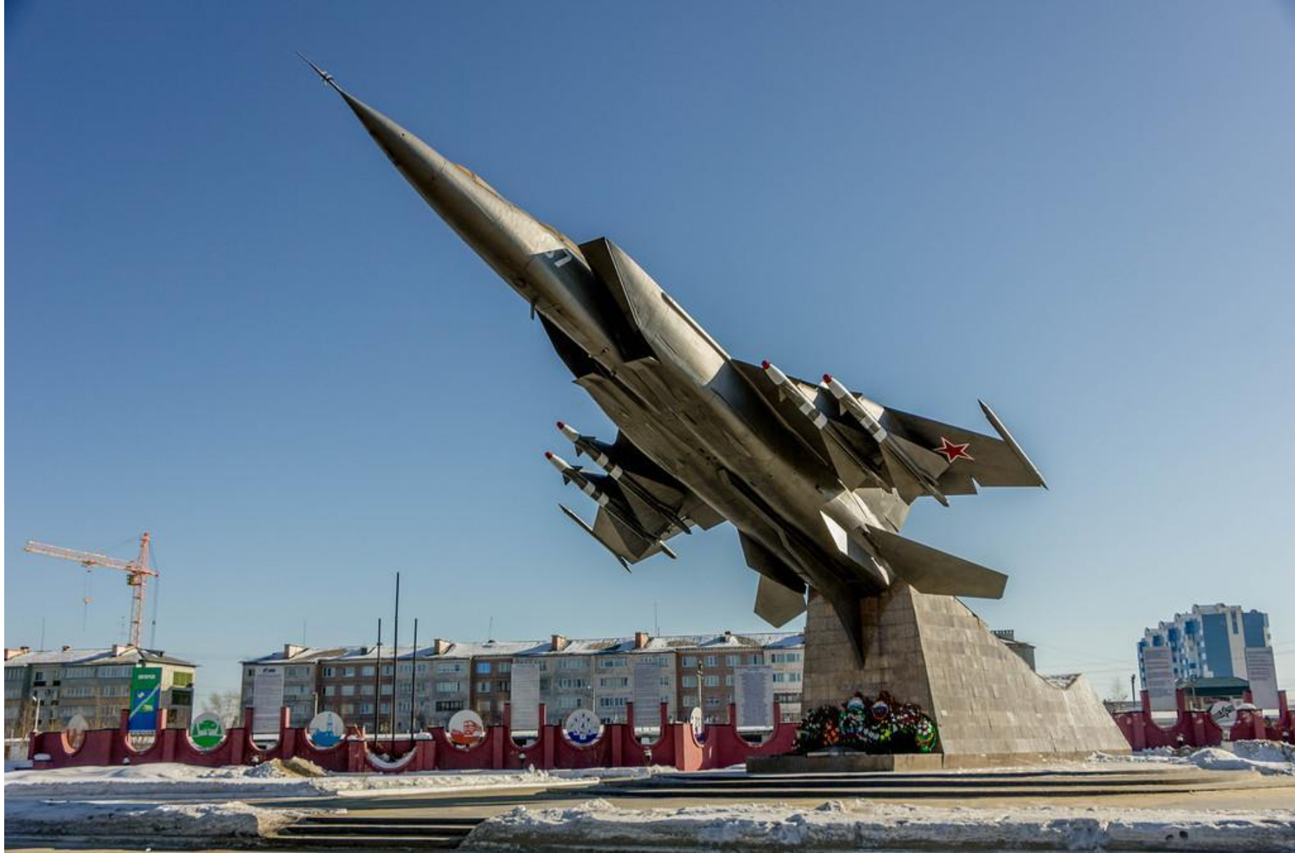
Памятник первопроходцам и защитникам земли Югорской