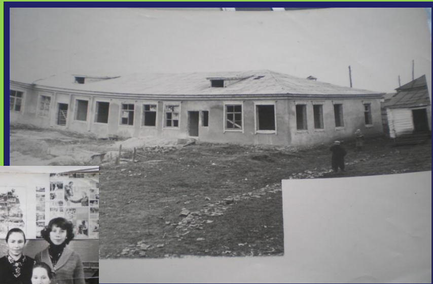
8 летняя школа 1960-70 гг.