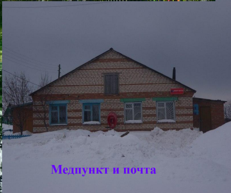
Медпункт и почта