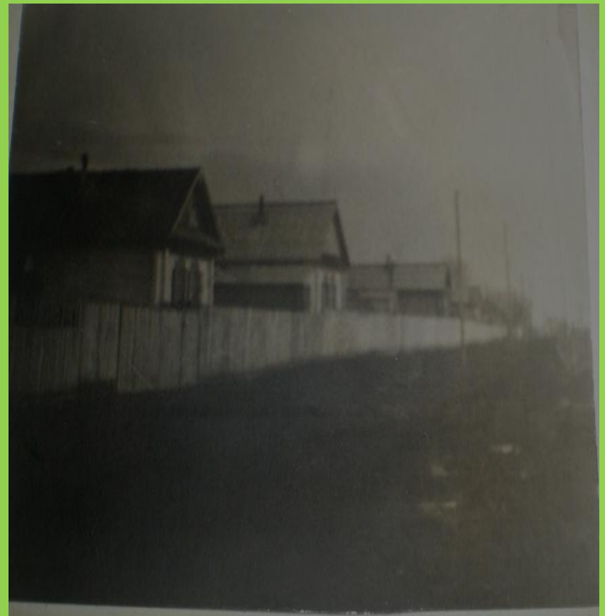
Дома рабочих совхоза