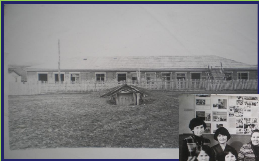
7 летняя школа 1948 года