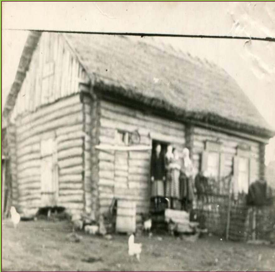
Дом с соломенной крышей