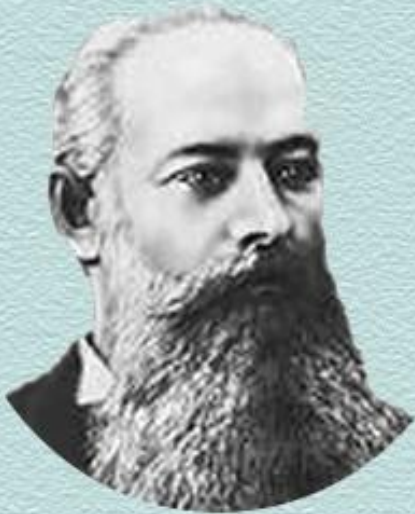
Василий Васильевич Докучаев

Долгое время существовало мнение, что почва – это горная порода.