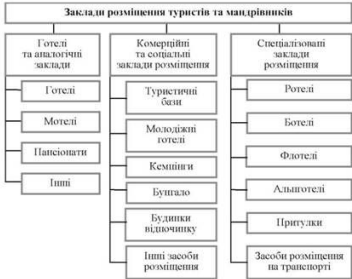
Рис. 5.2. Класифікація закладів розміщення

Готелі й мотелі - основні заклади розміщення, а всі інші - додаткові.