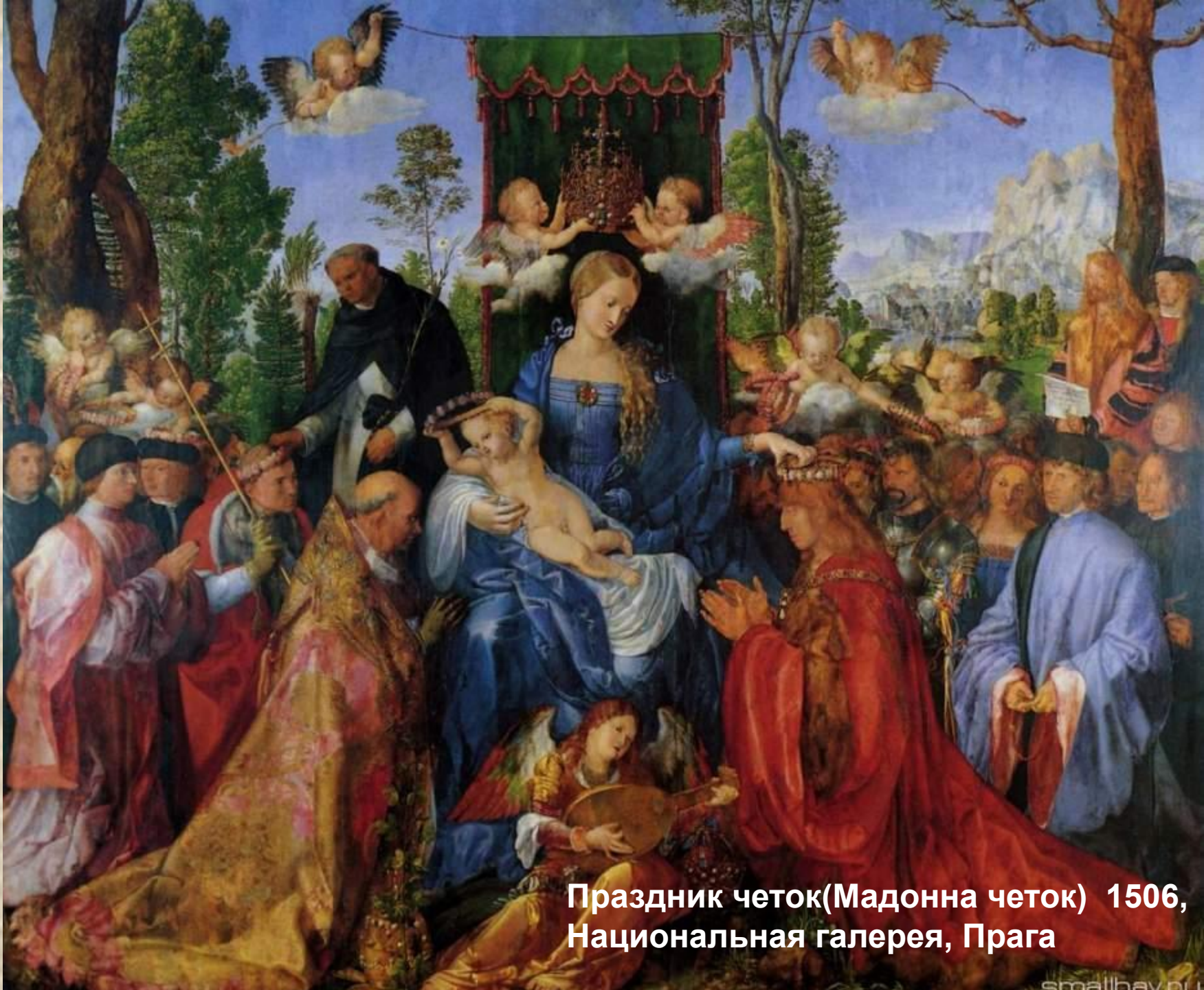
Праздник четок(Мадонна четок) 1506, Национальная галерея, Прага