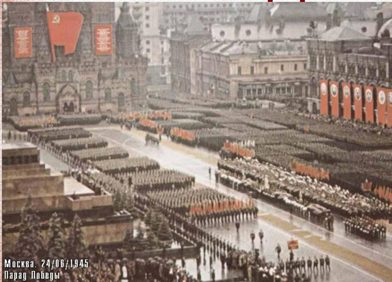
Москва. 24/06/1945 Парад Победы