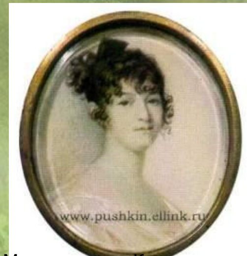
Миниатюра Ксавье де Местра. Н.О.Пушкина. 1800-е гг.