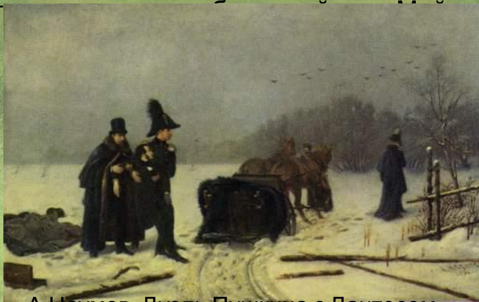
А.Наумов. Дуэль Пушкина с Дантесом.

Прожив 2 дня в страшных мучениях, Пушкин скончался 29 января 1837 г.