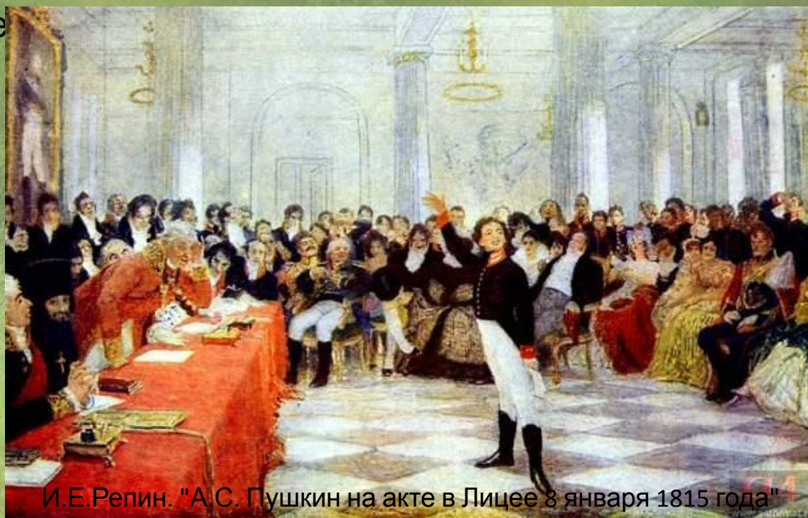
И.Е.Репин. "А.С. Пушкин на акте в Лицее 8 января 1815 года"

В 1811-ом году отец и дядя решают отправить Пушкина в только что открывшийся Царскосельский Лицей. Роль Лицея в становлении личности трудно переоценить, именно там он начал писать свои первые стихи, познакомился и подружился с такими знаменитыми в будущем людьми как Иван Пущин, Вильгельм Кюхельбекер, Антон Дельвиг и многими другими. В 1814 году было опубликовано первое стихотворение тогда еще пятнадцатилетнего