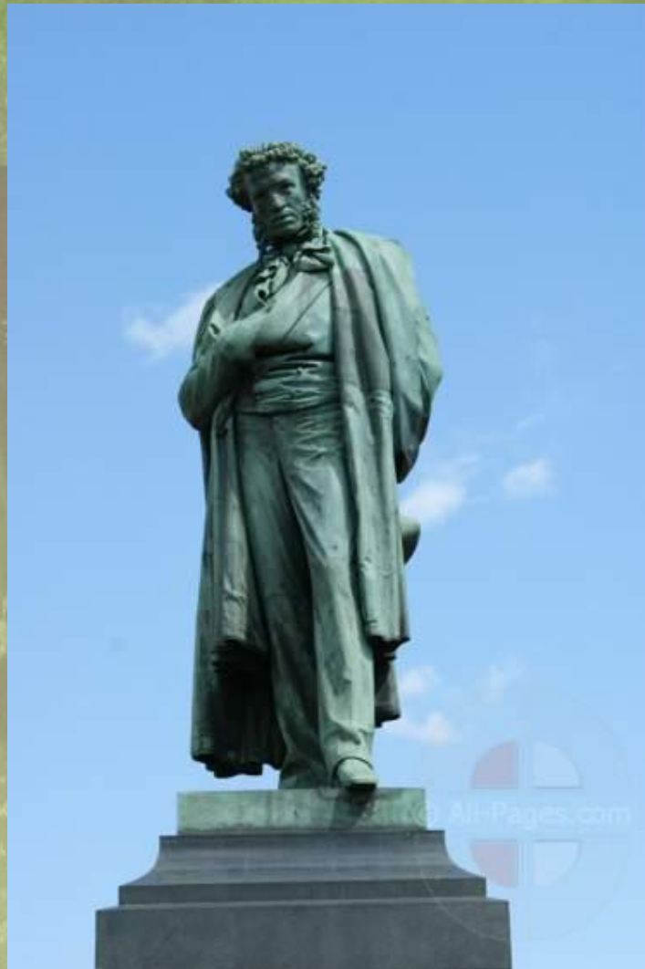
Памятник А.С.Пушкину в Москве

Его уж нет. Младой певец Нашел безвременный конец! Дохнула буря, цвет прекрасный Увял на утренней заре, Потух огонь на алтаре!..