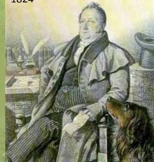
Г.Гампельн. С.Л.Пушкин. 1824

С раннего детства Пушкин рос и воспитывался в литературной среде, так что можно с уверенностью сказать о том, что его будущее было предопределено. Отец Александра Сергеевича был ценителем литературы, имел большую библиотеку, дядя был известным поэтом, в гостях у которого часто бывали многие известные деятели литературы того времени.