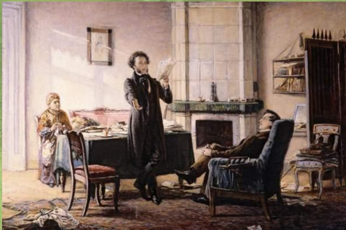
Н.Н. Ге. "Пуцин И.И. в Михайловском в гостях у Пушкина"

Огромное влияние на будущего поэта оказала его няня, Арина Родионовна, которую поэт будет вспоминать всю свою жизнь и посвятит немало литературных произведений.