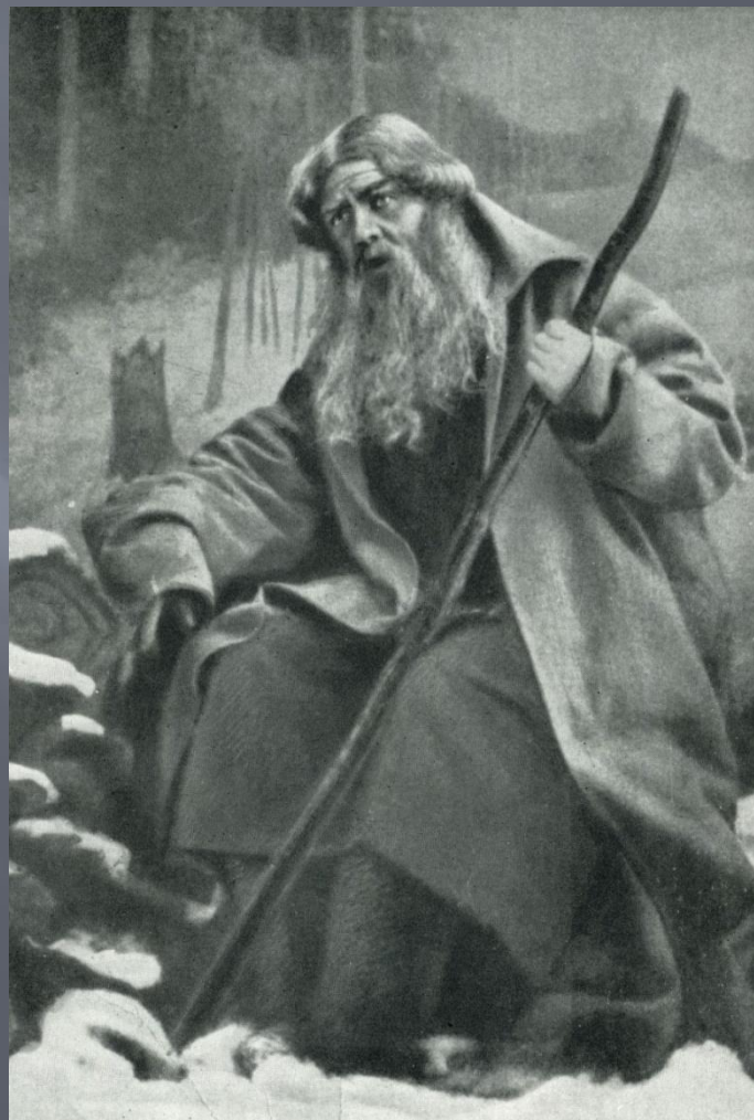
Шаляпин Ф.И. – в роли Ивана Сусанина.

Место действия: село Домнино, Польша, Москва (в эпilogе). Время действия: 1612 – 1613 годы.