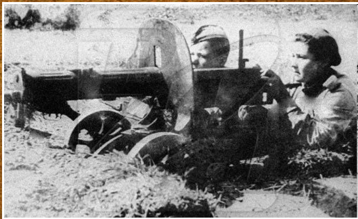
Маркаускене Дануте Юргио — пулеметчица