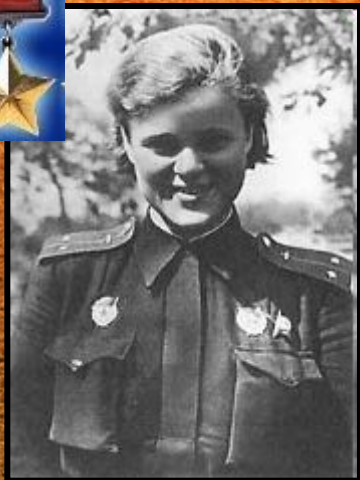
Руднева Женя – уроженка Запорожской обл.

совершила 645 боевых ночных вылетов на уничтожение переправ, железнодорожных эшелонов, живой силы и техники противника. Погибла смертью храбрых в 1944 года при выполнении боевого задания. Похоронена в городе-герое Керчь.