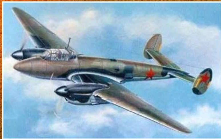
Пе - 2

46-й гвардейский ночной бомбардировочный авиационный Краснознамённый Таманский ордена Суворова 3-й степени полк