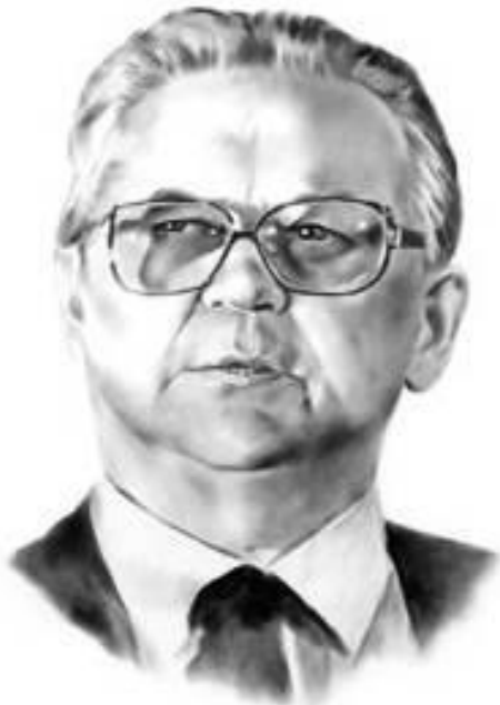
Олесь Гончар (1918—1985)