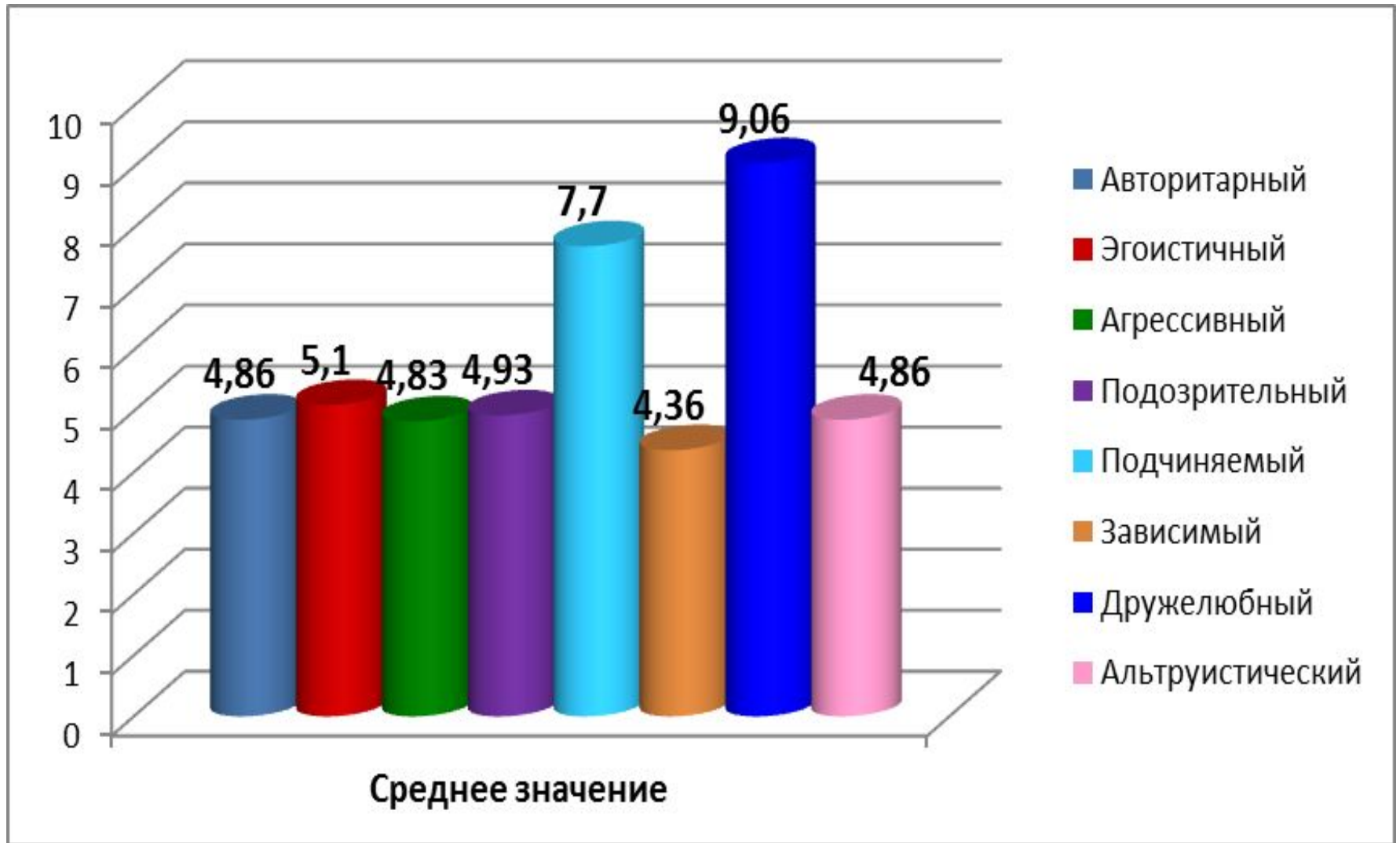
Рис.1 Типы межличностных отношений испытуемых