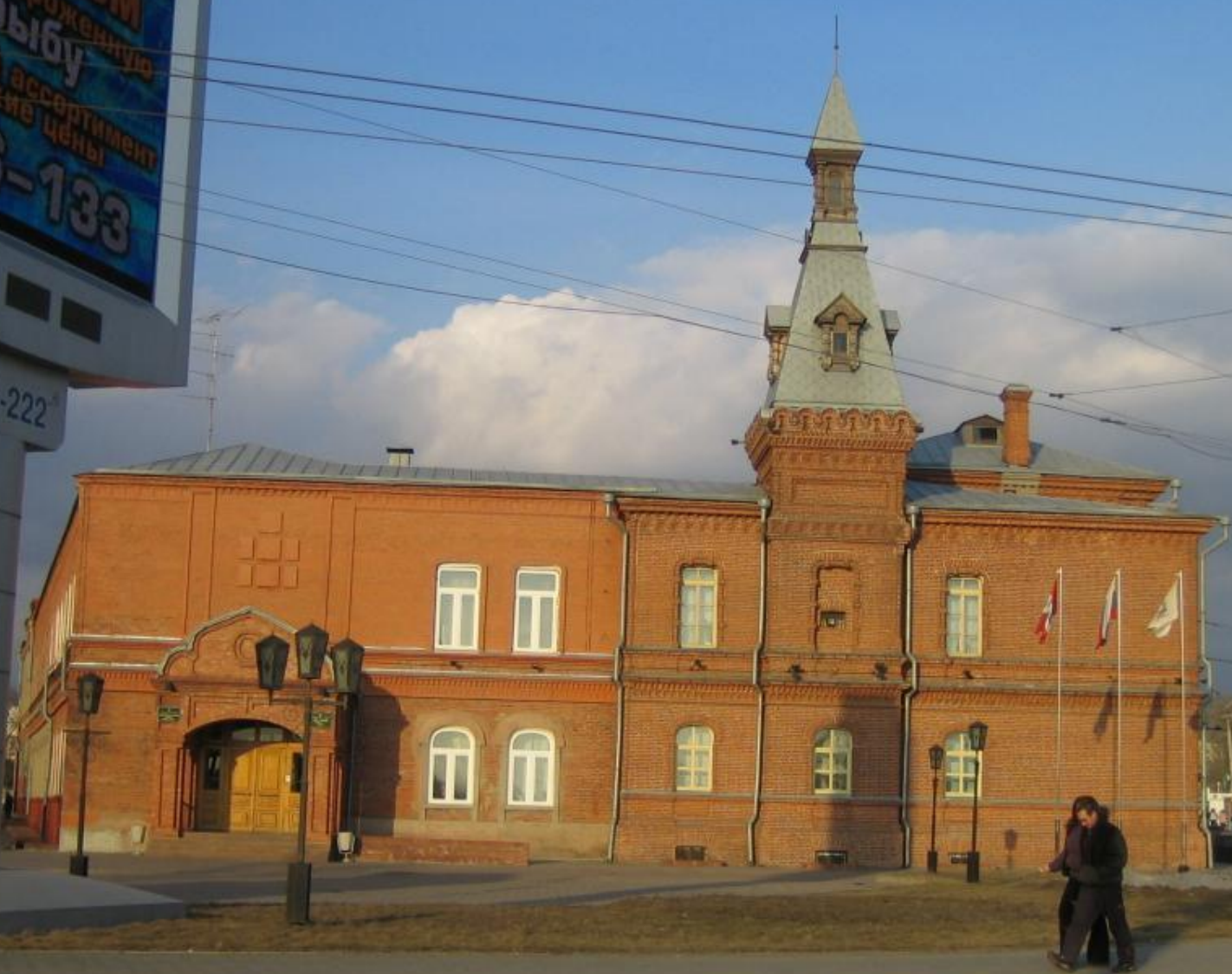
Здание Городской Думы. 1897 г. Архитектор Вараксин Н.Е.