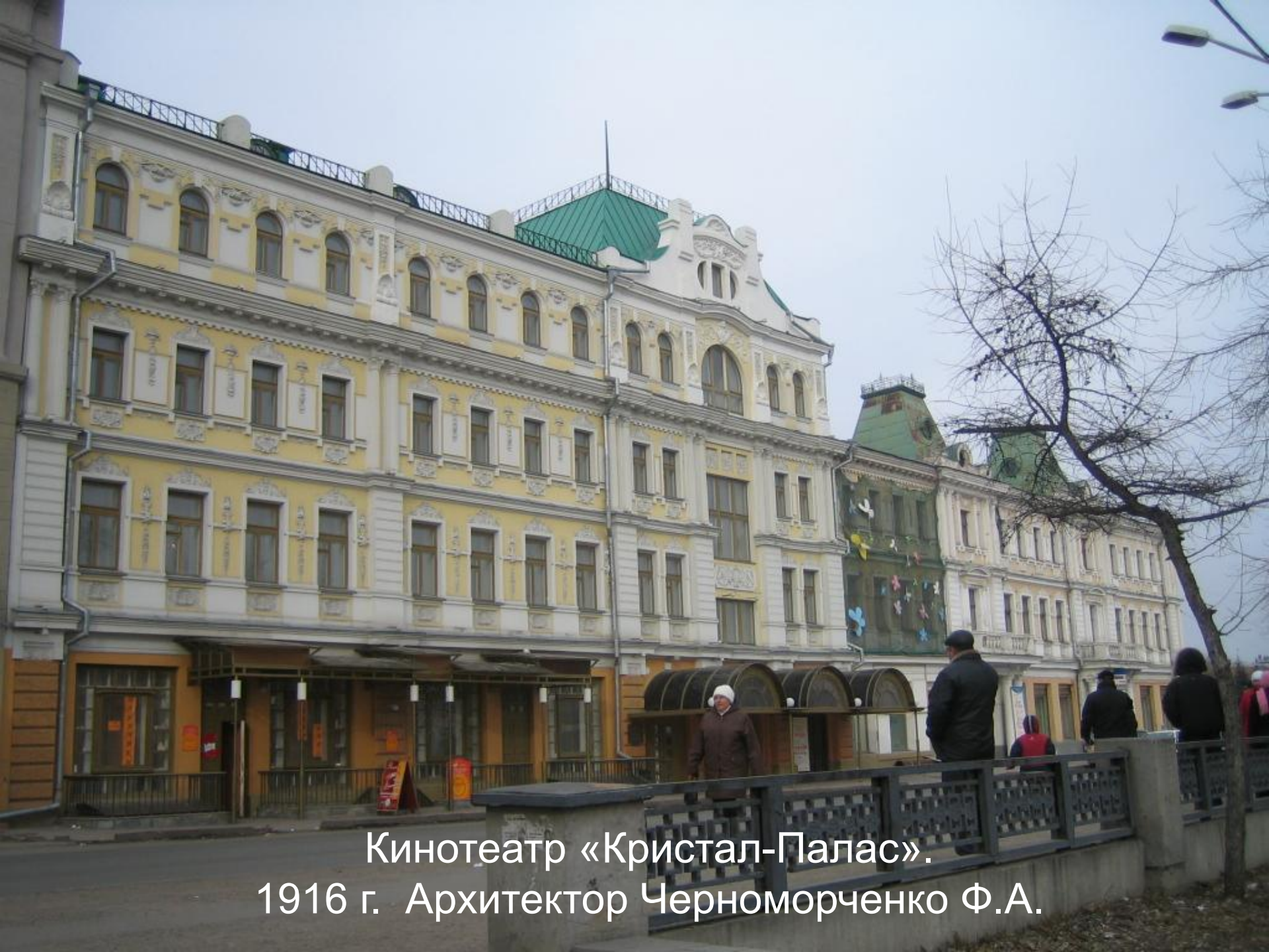
Кинотеатр «Кристал-Палас». 1916 г. Архитектор Черноморченко Ф.А.