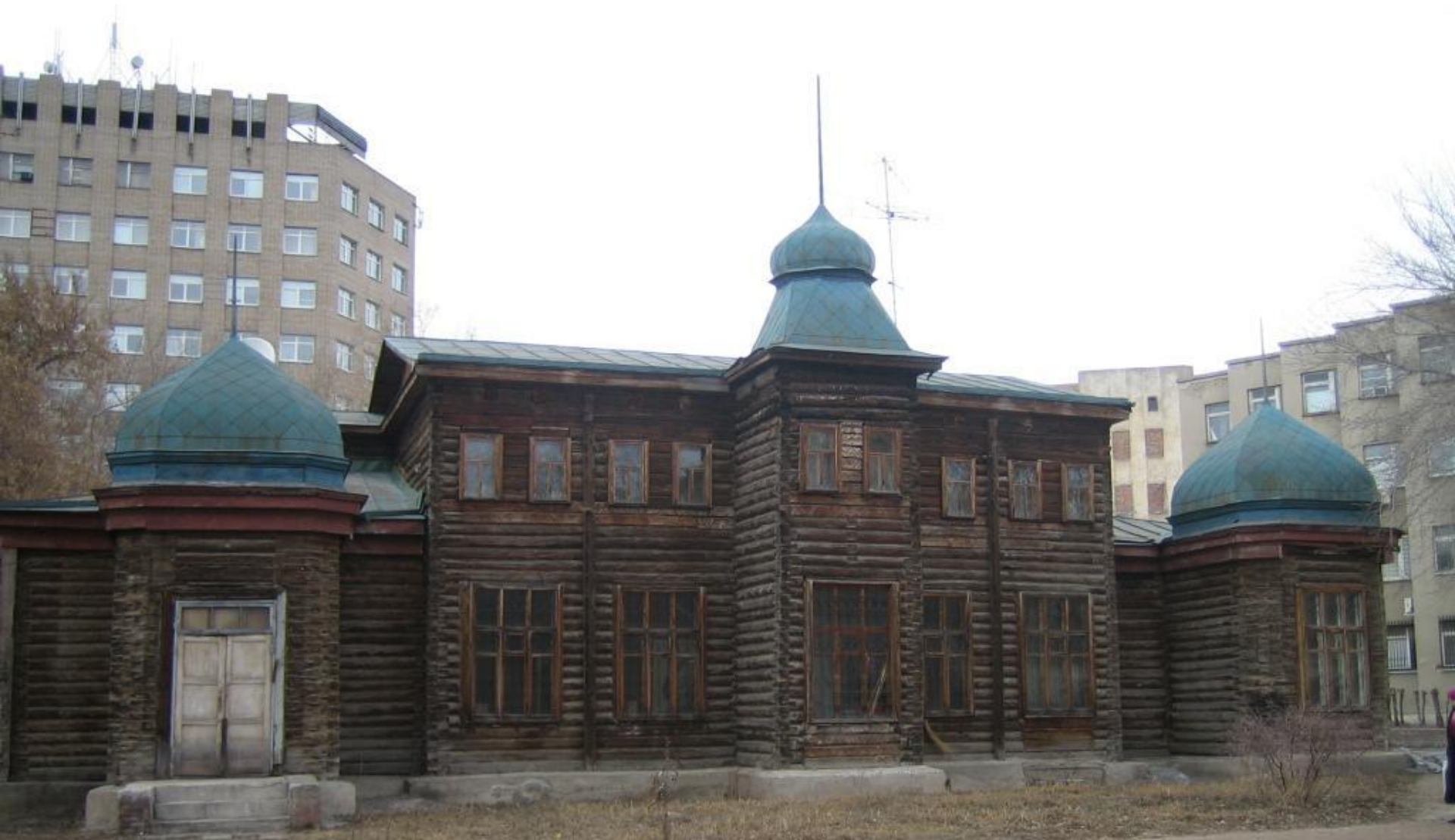
Здание музея Западно-Сибирского отдела Императорского русского географического общества. 1896 – 1900 г. Архитектор Хворинов И.Г.