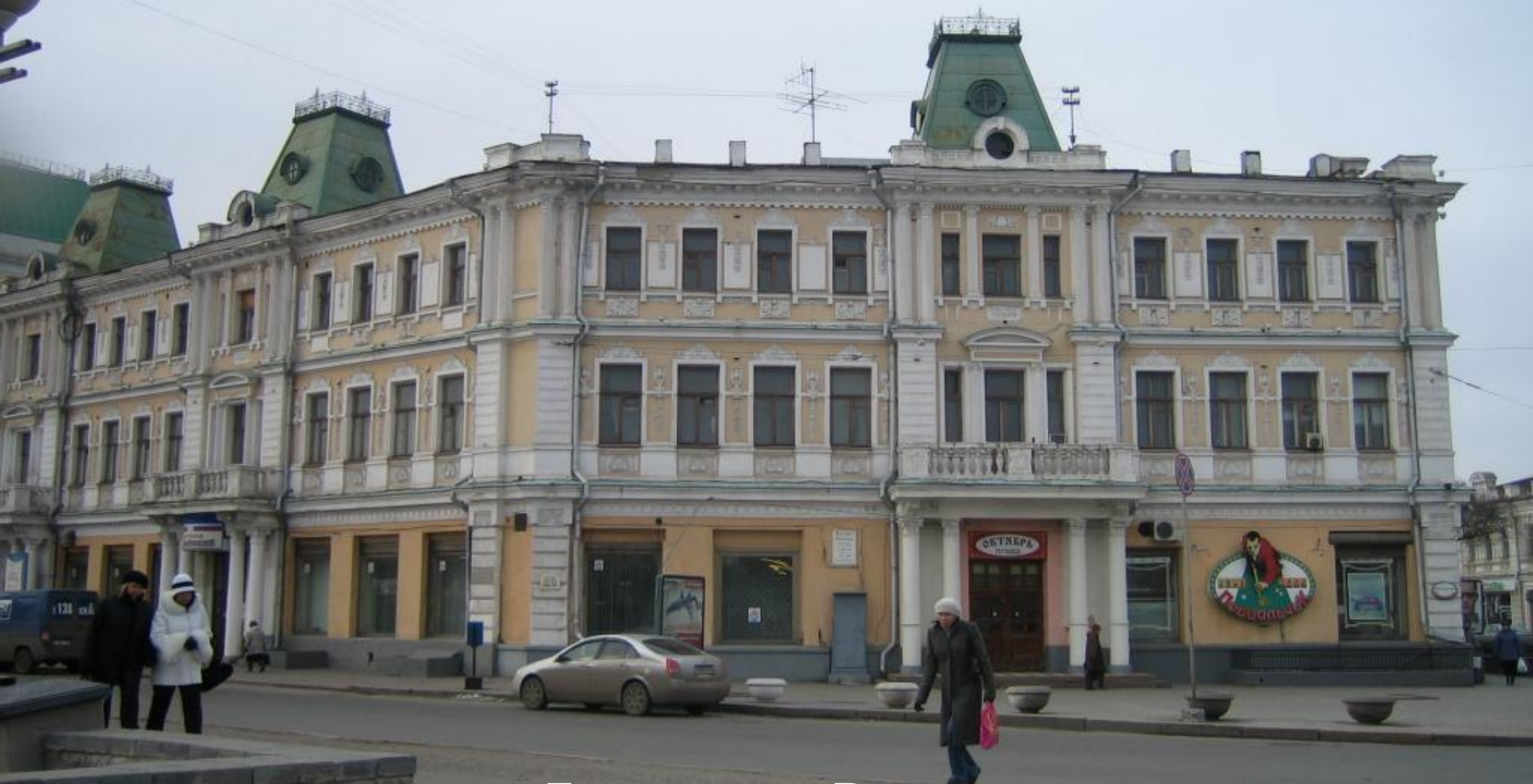
Гостиница «Россия». 1906 г. Архитектор Хворинов И.Г.