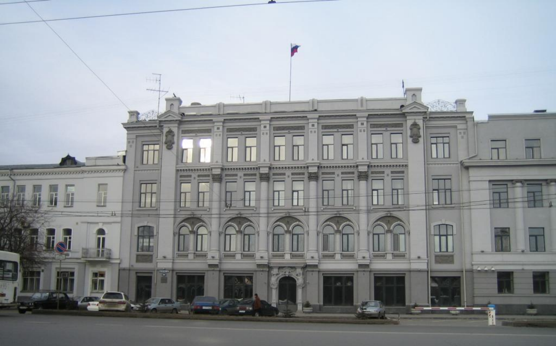
Бывший дом Русско-Азиатской компании на Втором Взвозе. 1917 г. Архитектор Черноморченко Ф.А.