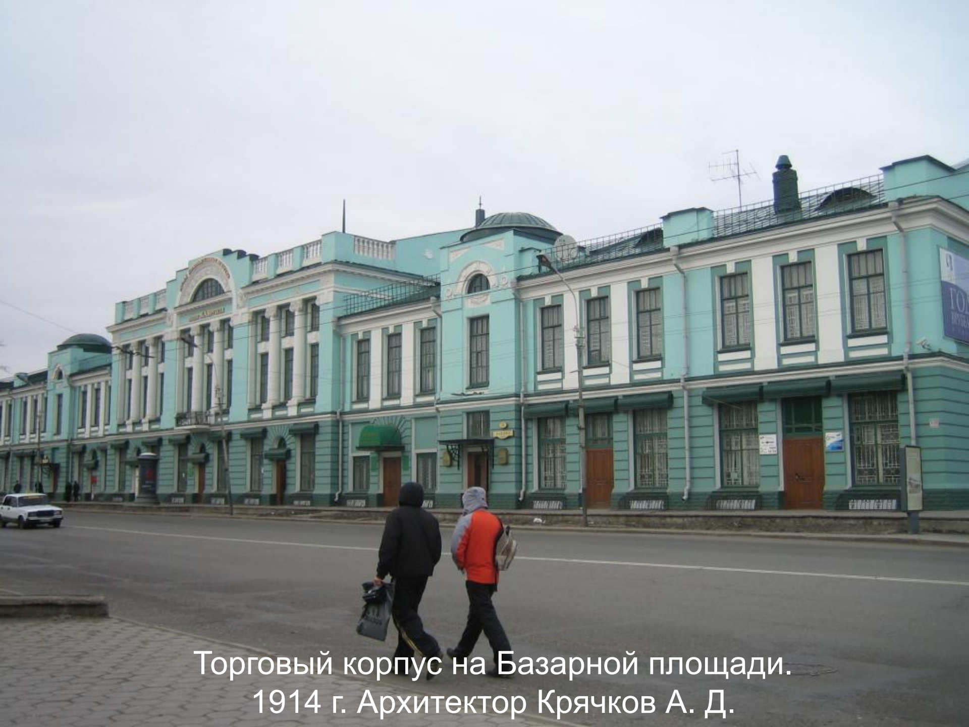
Торговый корпус на Базарной площади. 1914 г. Архитектор Крячков А. Д.