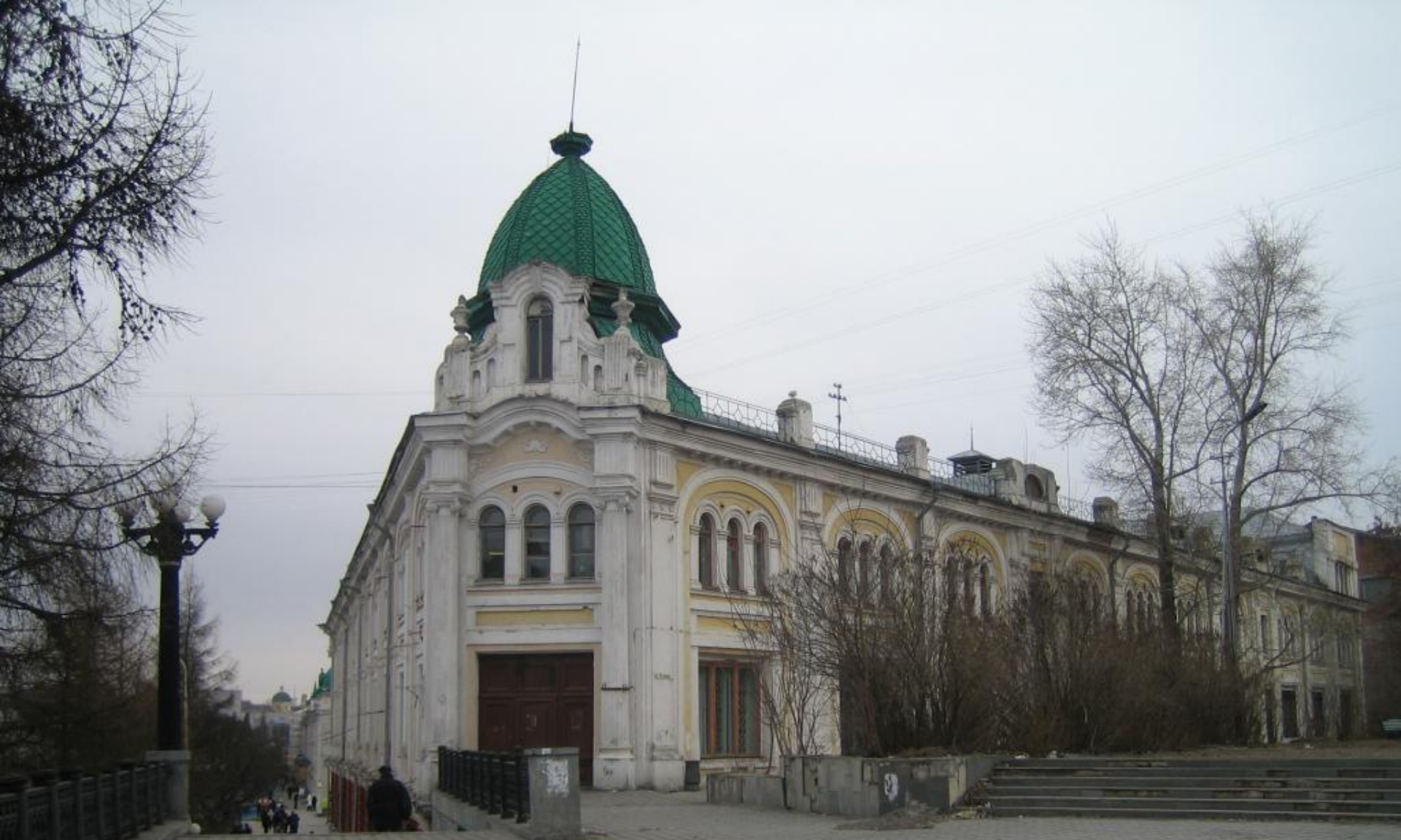
Бывший магазин Фабрично-торгового Товарищества «Братья Овсянниковы и А. Ганшин с сыновьями». Архитектор неизвестен. Вторая очередь строительства. 1915 г.