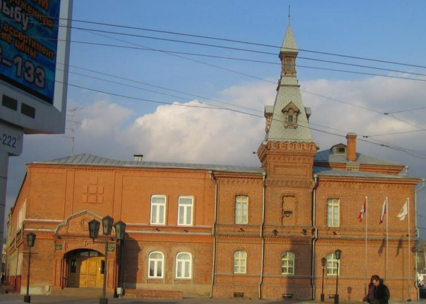
Здание Городской Думы. 1897 г. Архитектор Вараксин Н.Е.