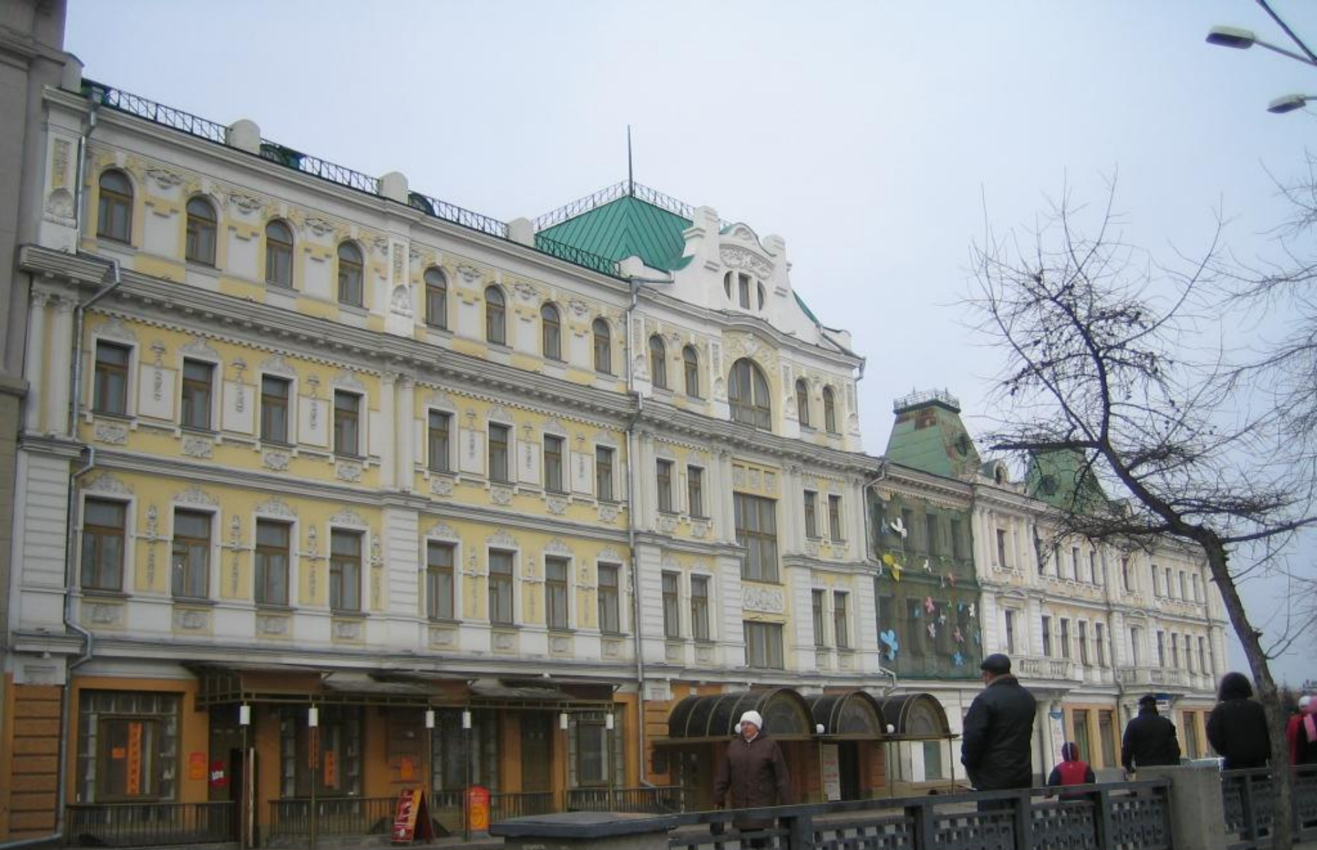
Кинотеатр «Кристал-Палас». 1916 г. Архитектор Черноморченко Ф.А.