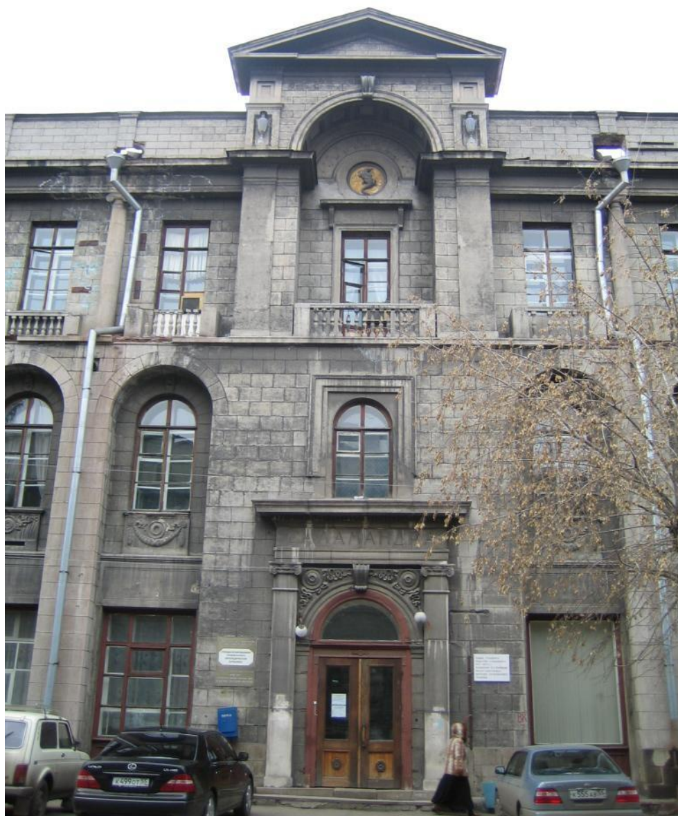
Здание компании «Саламандра». 1914 г. Архитектор Веревкин Н.Н.