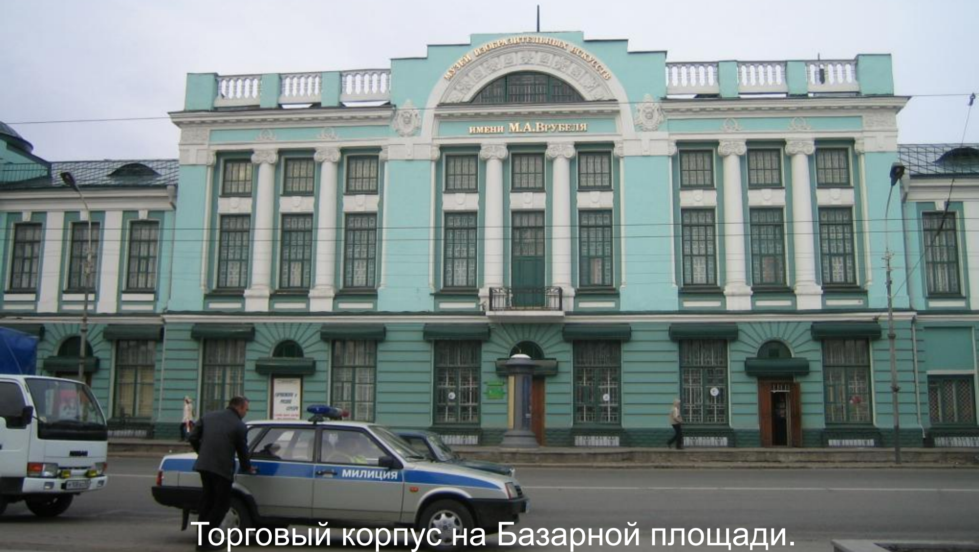
Торговый корпус на Базарной площади. 1914 г. Архитектор Крячков А. Д.