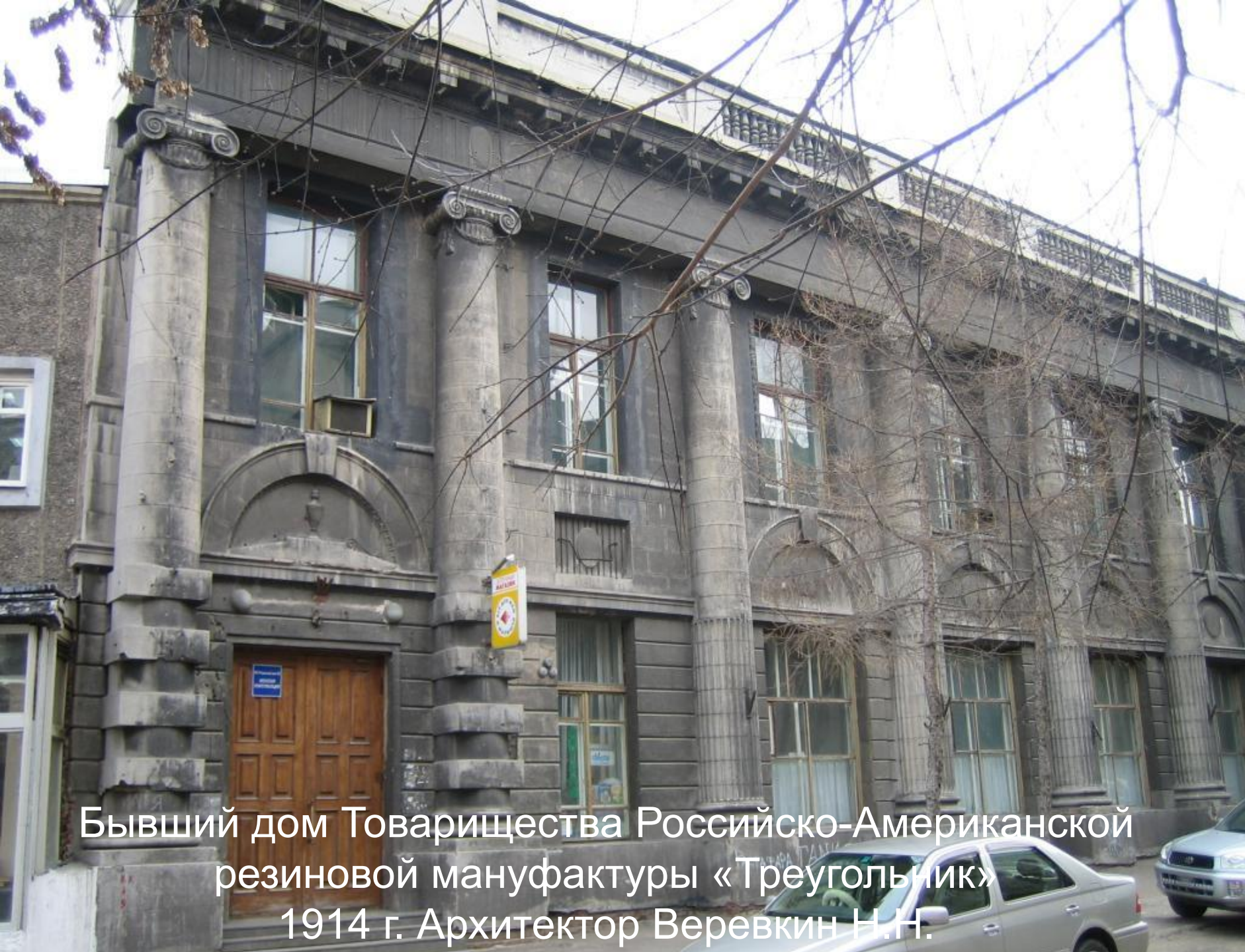
Бывший дом Товарищества Российско-Американской резиновой мануфактуры «Треугольник» 1914 г. Архитектор Веревкин Н.Н.