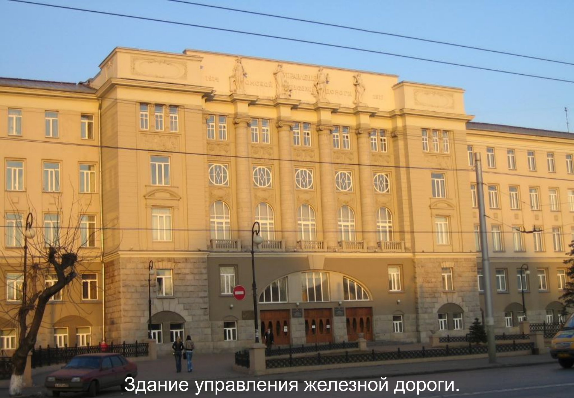
Здание управления железной дороги. 1914 - 1916 г. Архитектор Лидваль Ф.И.