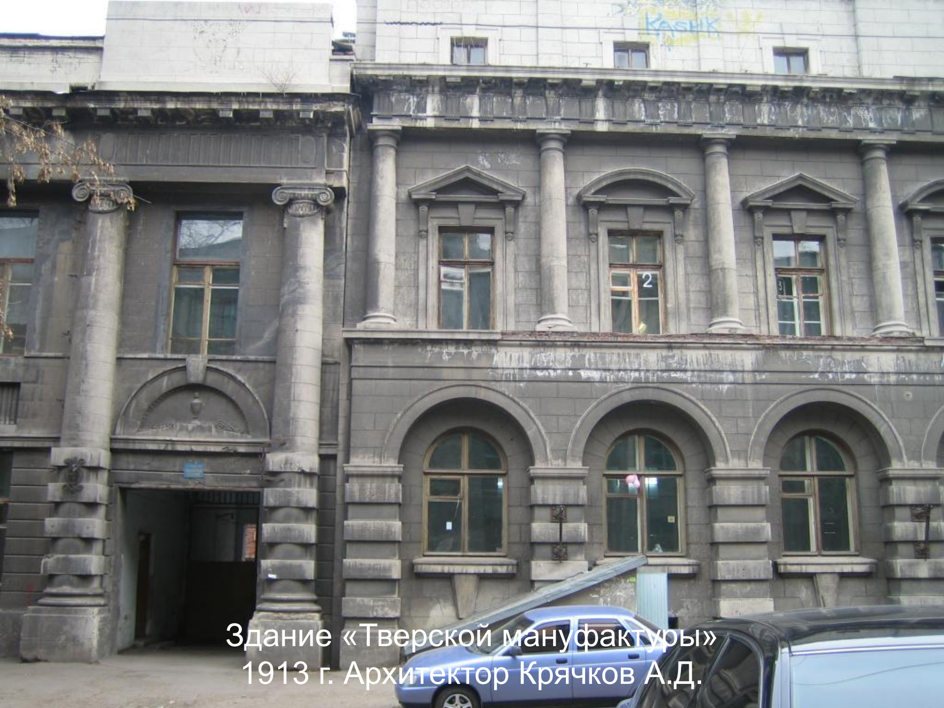
Здание «Тверской мануфактуры» 1913 г. Архитектор Крячков А.Д.