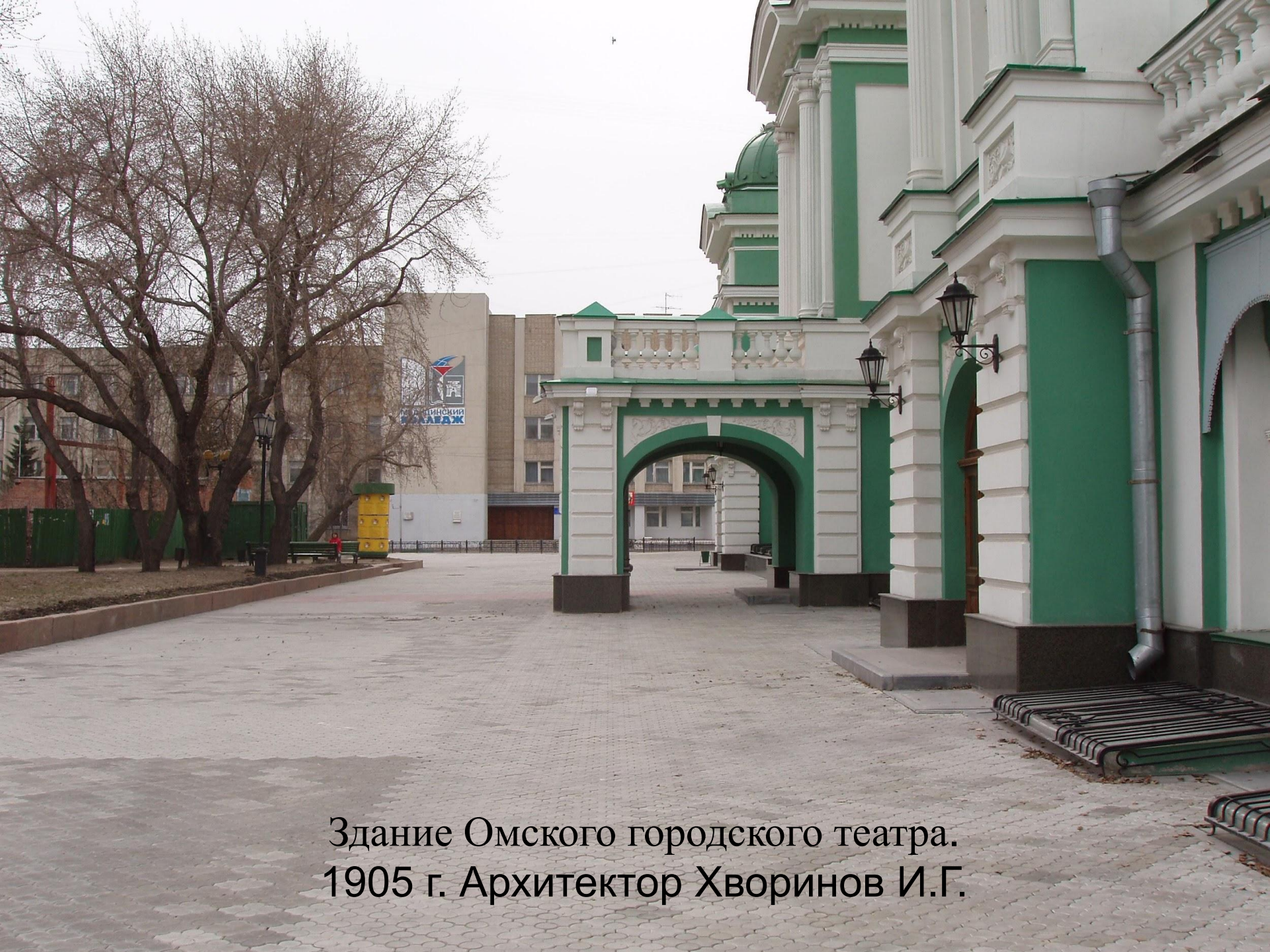
Здание Омского городского театра. 1905 г. Архитектор Хворинов И.Г.