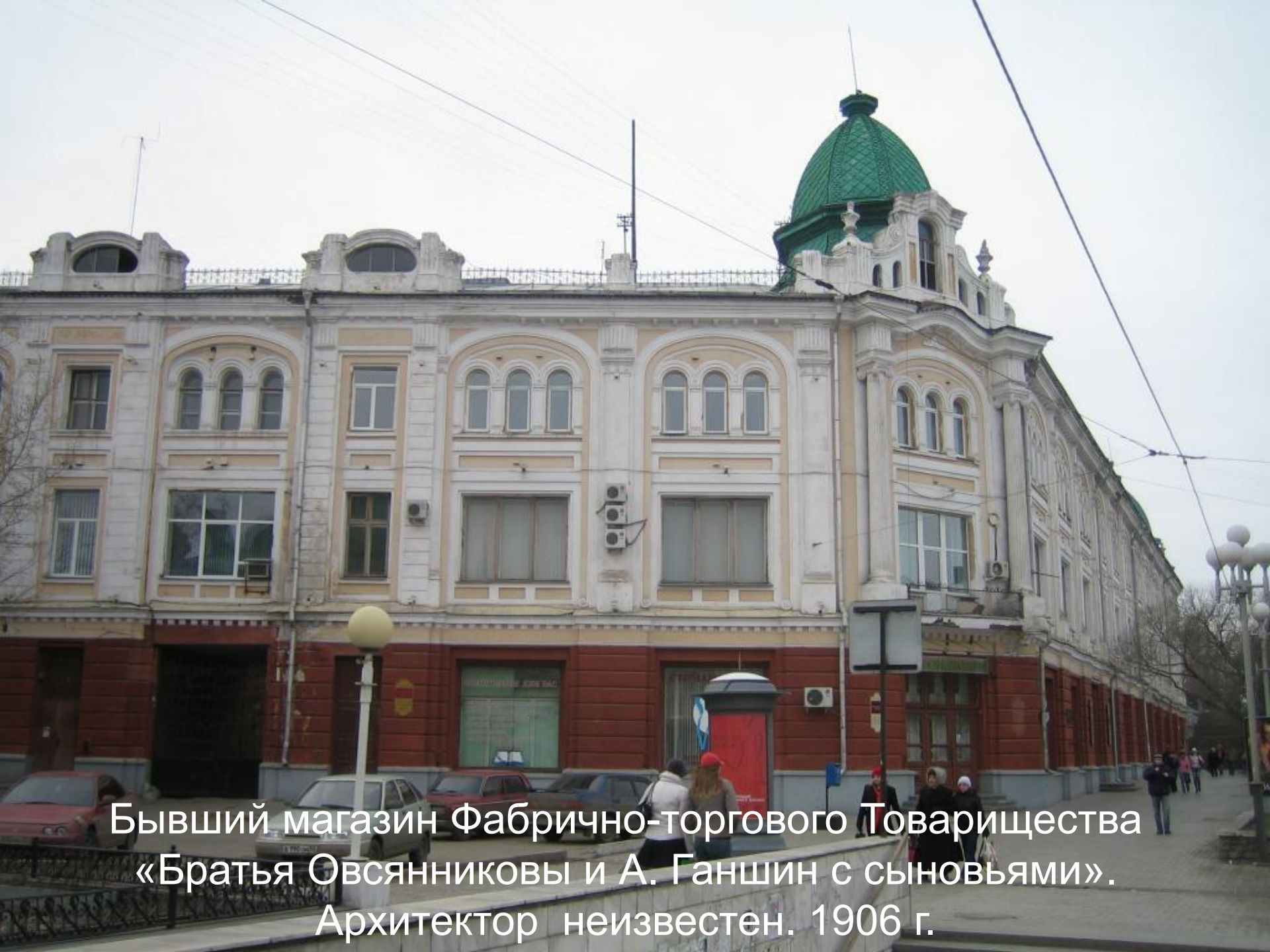
Бывший магазин Фабрично-торгового Товарищества «Братья Овсянниковы и А. Ганшин с сыновьями». Архитектор неизвестен. 1906 г.