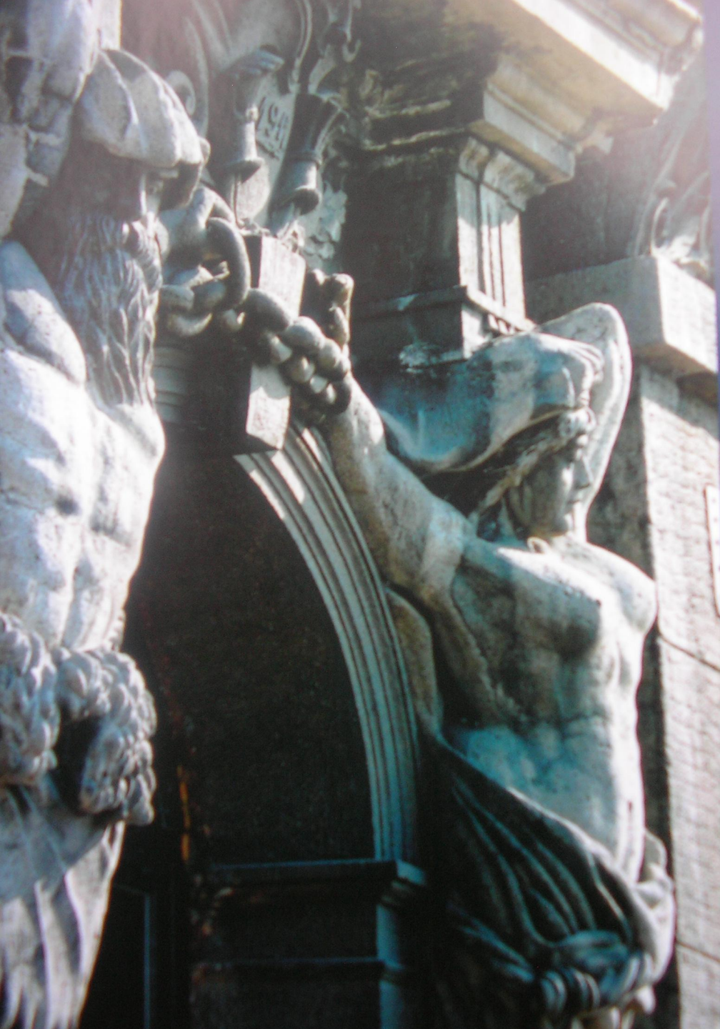
Бывший дом Русско- Азиатской компании на Втором Взвозе. 1917 г. Скульптор Винклер В.Ф.