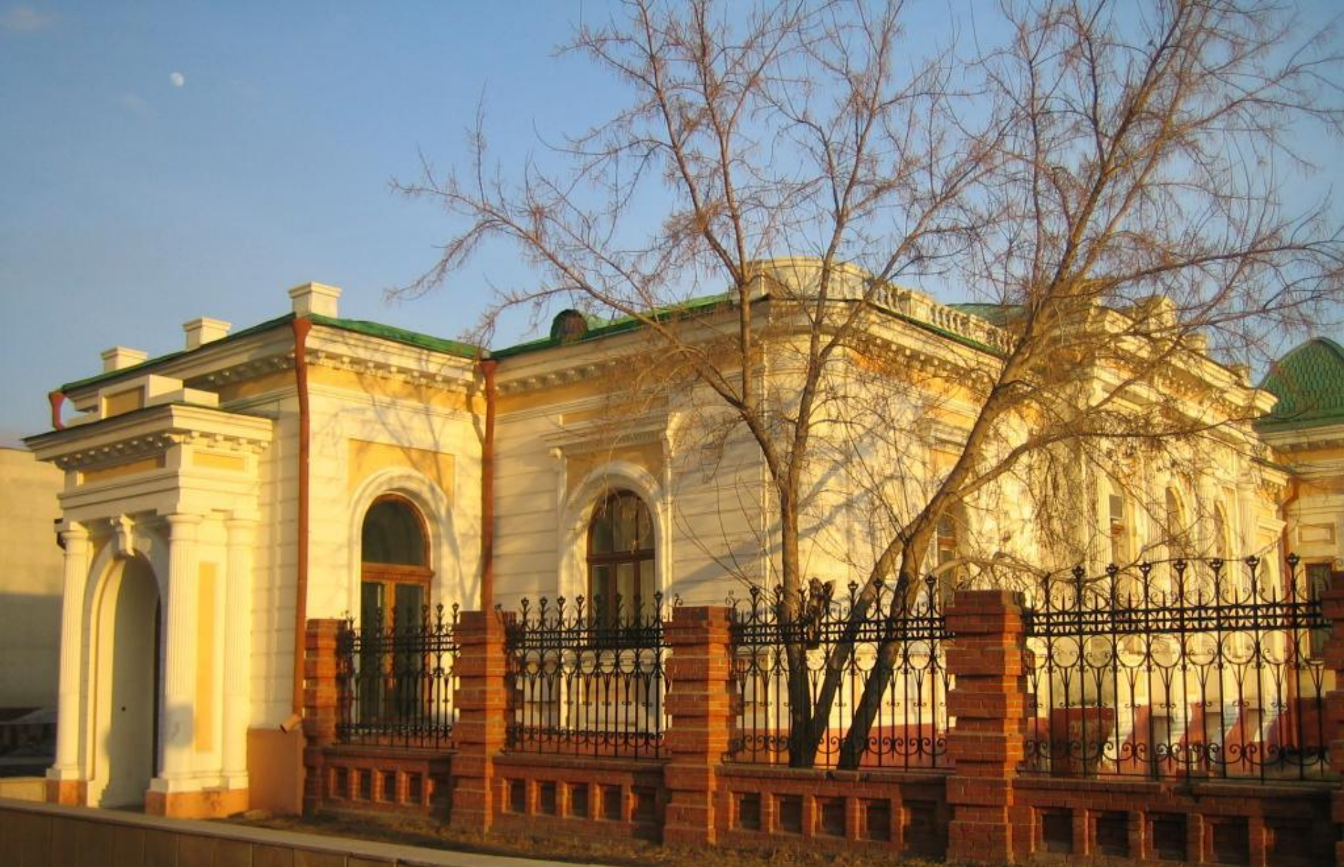
Дом купца Батюшкина К.А. 1901 – 1902 г. Архитектор Хворинов И.Г.