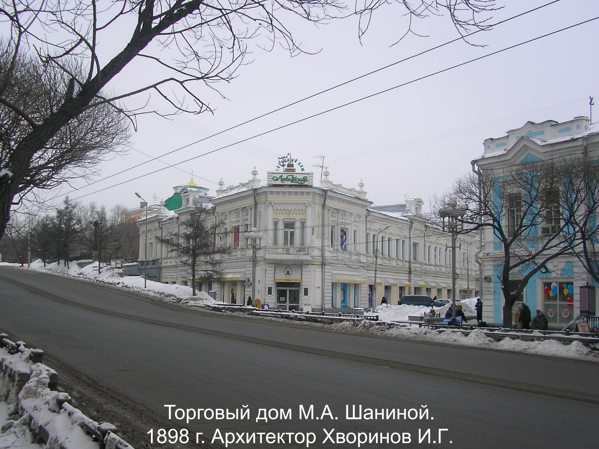
Торговый дом М.А. Шаниной. 1898 г. Архитектор Хворинов И.Г.