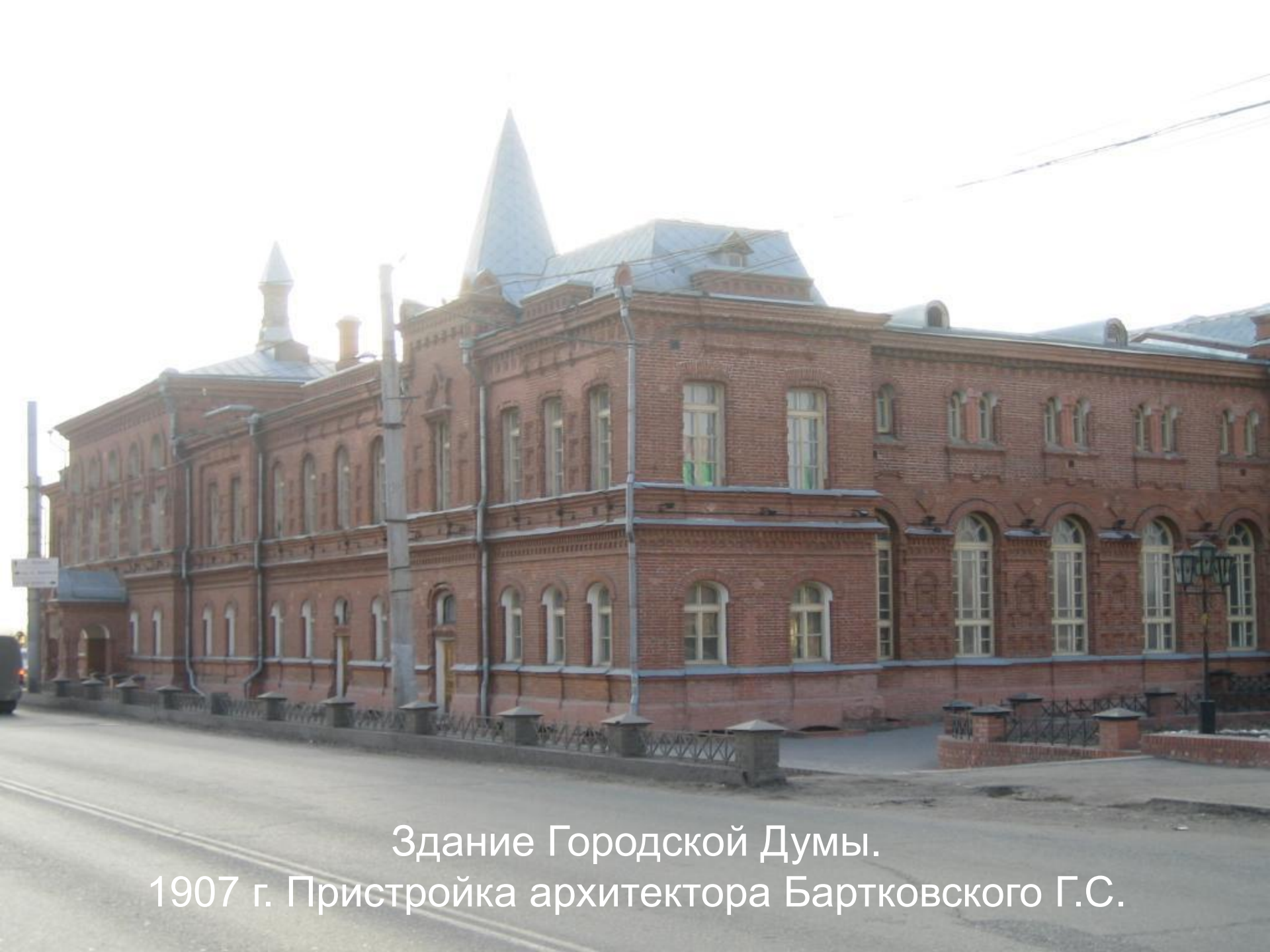
Здание Городской Думы. 1907 г. Пристройка архитектора Бартковского Г.С.