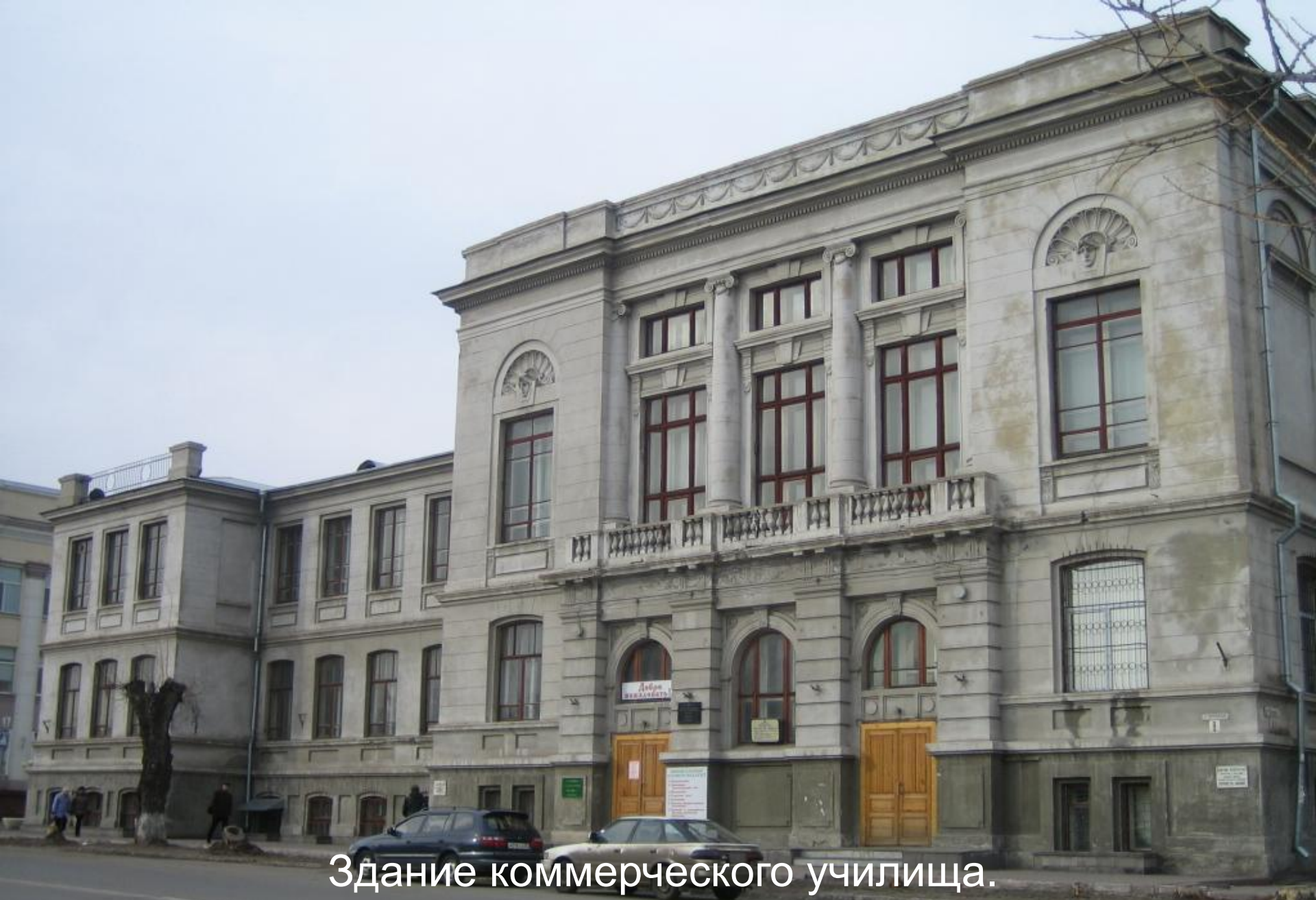
Здание коммерческого училища. 1916 г. Архитектор Черноморченко Ф.А.