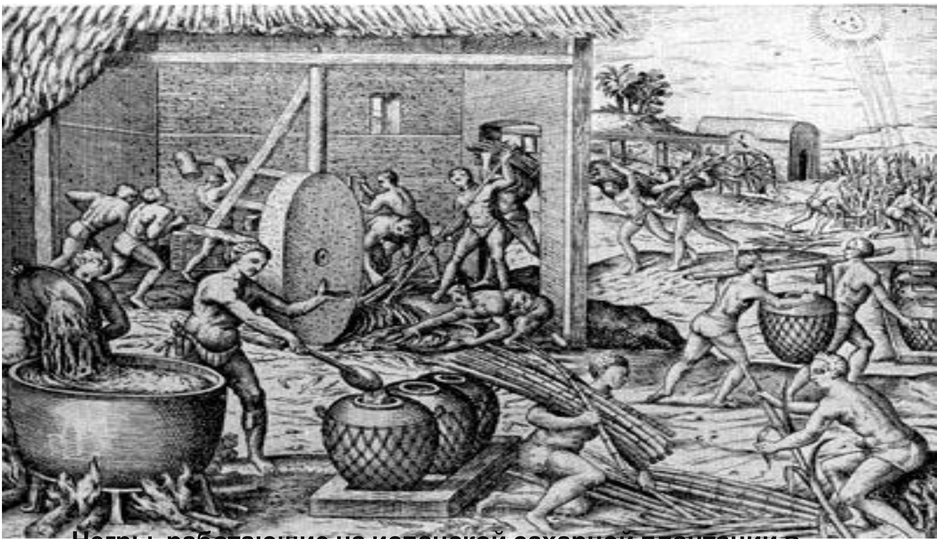
Негры, работающие на испанской сахарной плантации в Америке. Гравюра начала XVII в.