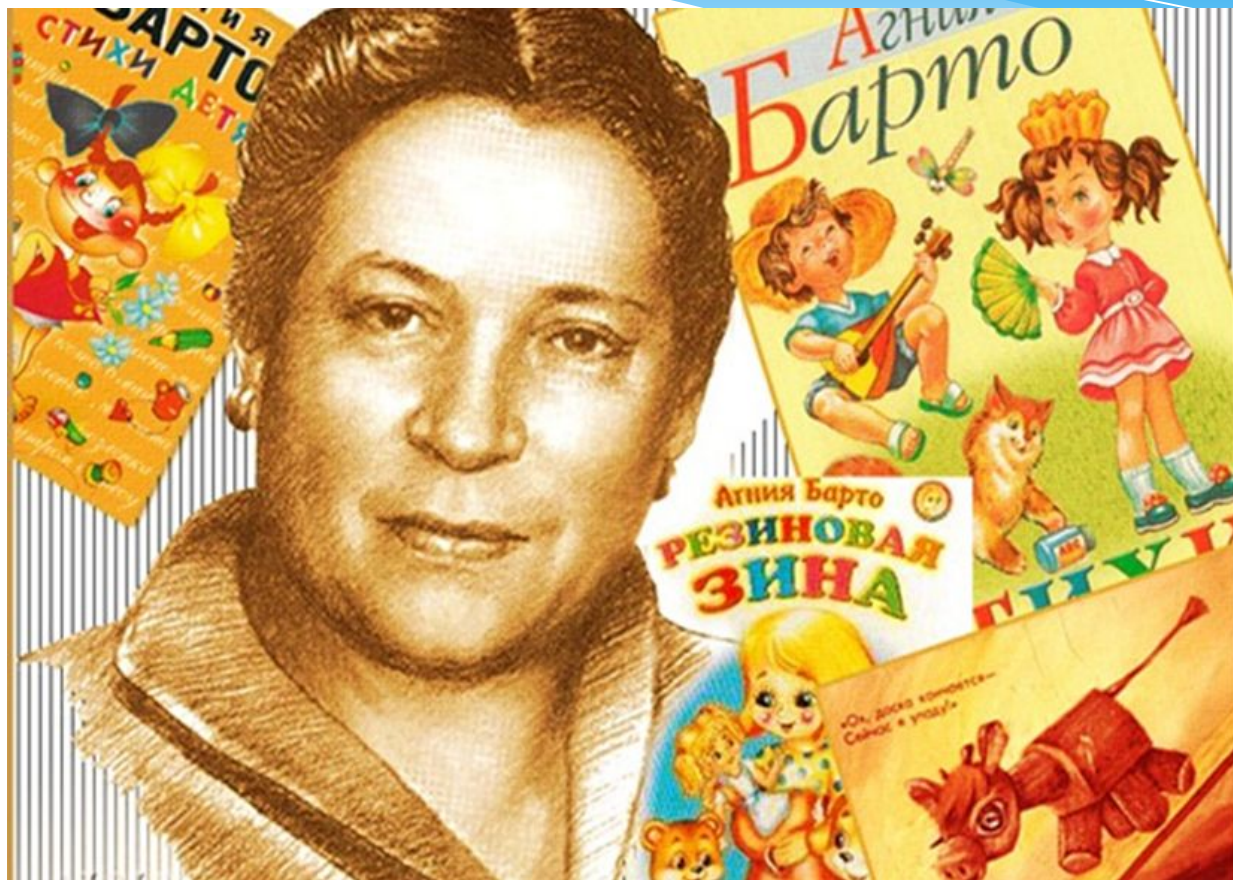
Агния Львовна Барто