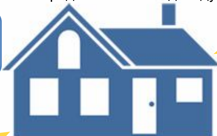
Управління соціального захисту населення