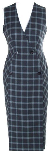
Репин А. Glance Lux