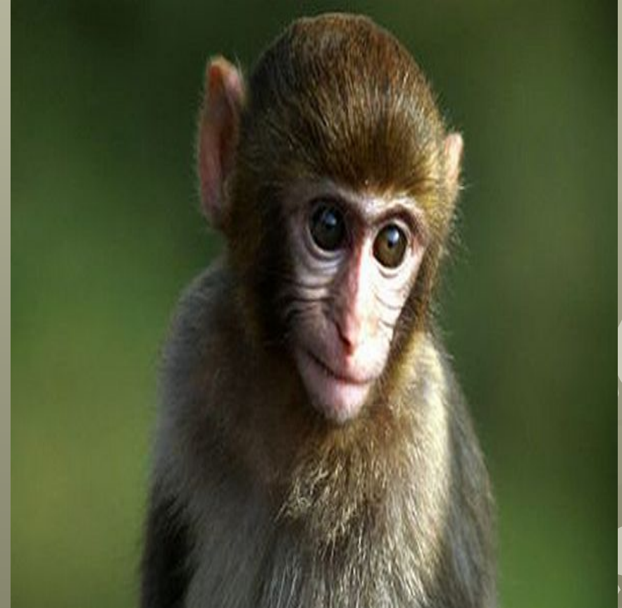
Макака - резус