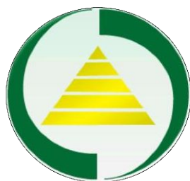
АО «Фонд гарантирования страховых выплат»

Четкое разграничение резервов и собственных средств