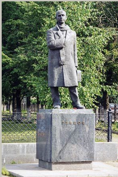
Памятник Н. Рубцову в г. Вологде