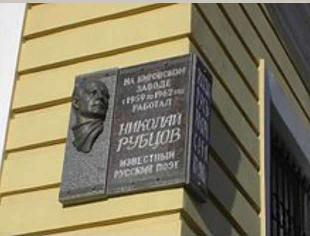
Мемориальная доска на здании Кировского завода в г. Санкт-Петербурге