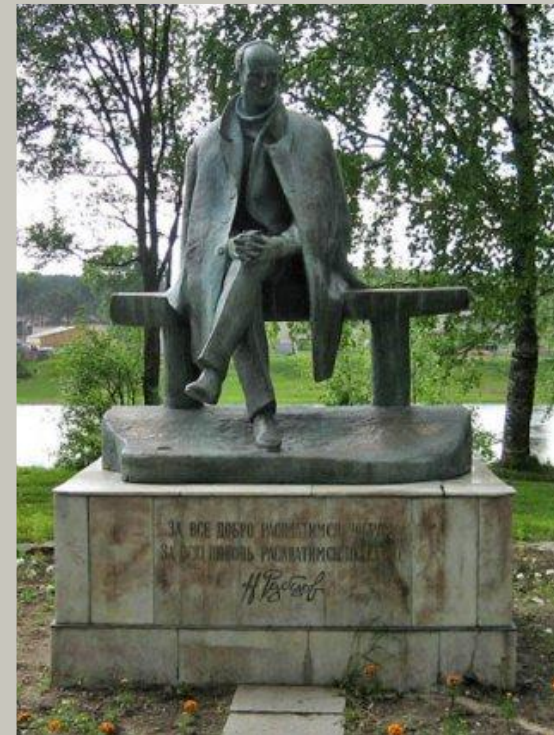
Памятник Н. Рубцову в г. Тотьме