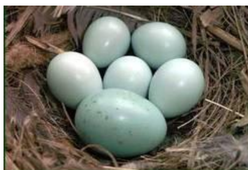
Горихвостка, яйцо кукушки в гнезде горихвостки

У открыто гнездящихся птиц самка, сидящая на гнезде почти неотличима от окружающего фона. Соответствует фону и пигментированная скорлупа яиц. Интересно, что у птиц, гнездящихся в дупле, на деревьях, самки нередко имеют яркую окраску, а скорлупа светлая.