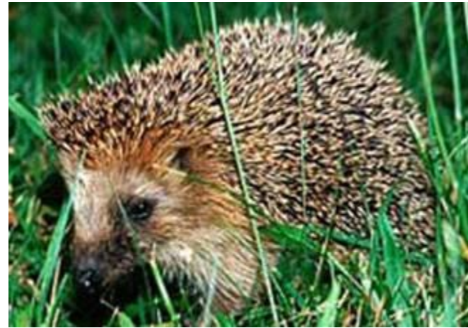
Иглы у дикобраза и ежа