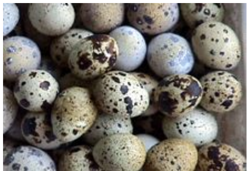
Перепел и его яйца