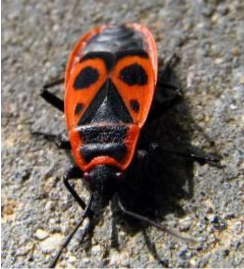
Клоп - солдатик