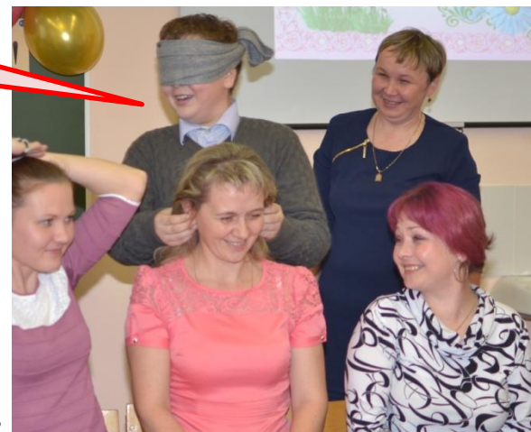
Конкурс «Найди свою маму»

На этой страничке представлены самые интересные моменты этой встречи. Но больше всего нашим мамам понравились презентации подготовленные учениками. В них ребята сказали простые, но душевные слова в их адрес.