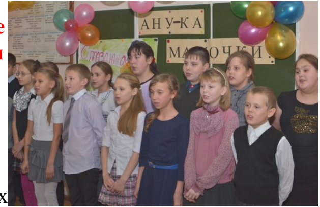
Осенняя песенка для мам в исполнении 5 класса