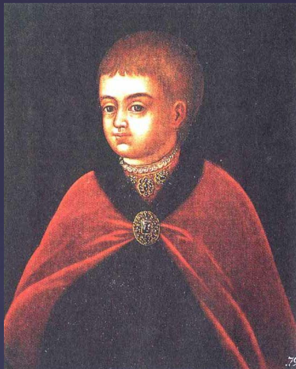
Петр I в детстве