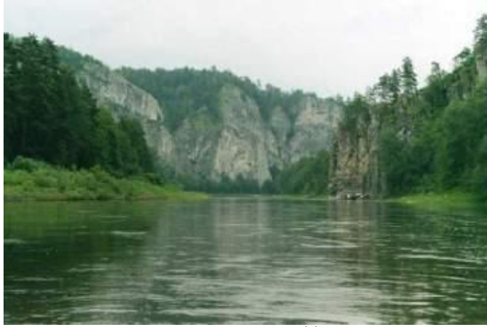
Национальный парк «Башкирия»

На территории республики находится национальный парк «Башкирия», Башкирский заповедник, Южно-Уральский заповедник, заповедник Шульган-Таш. На территории Шульган-Таша находится одноимённая пещера, более известная как Капова — одна из крупнейших пещер Урала.