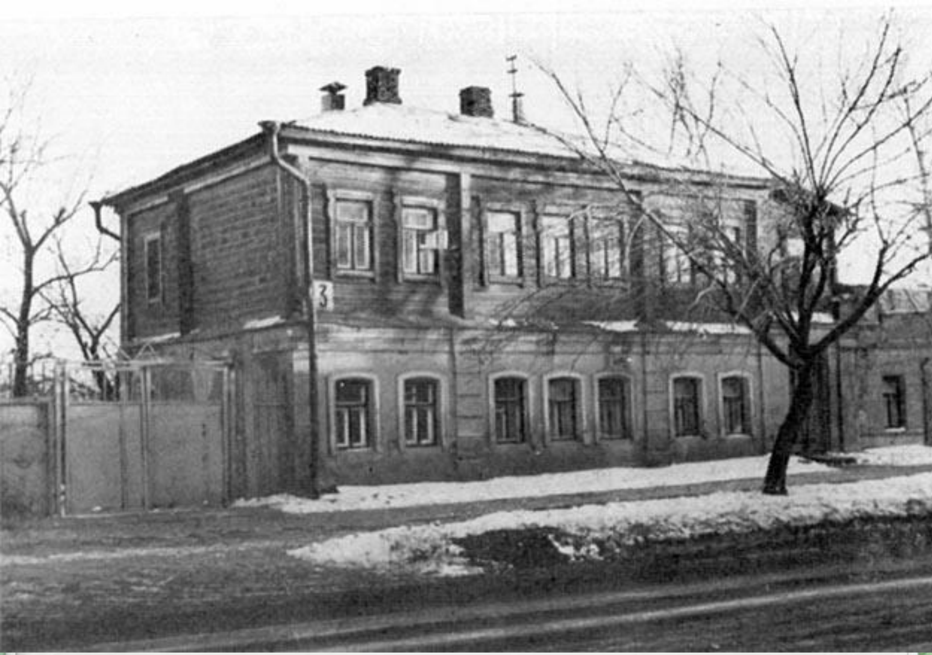
Воронеж. Дом, в котором родился И.А. Бунин