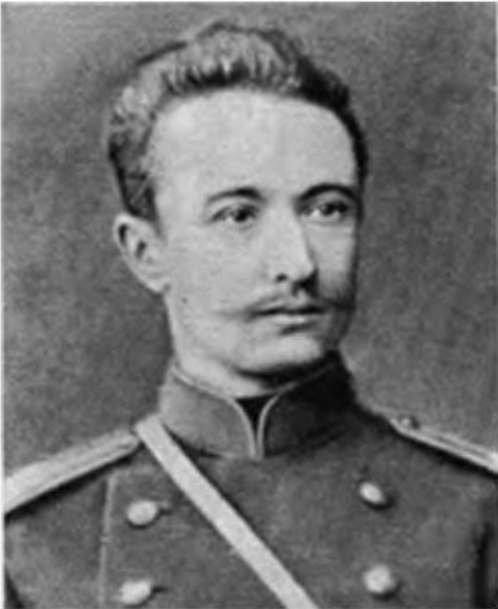
А.А.Брусилов - офицер 15 драгунского Тверского полка