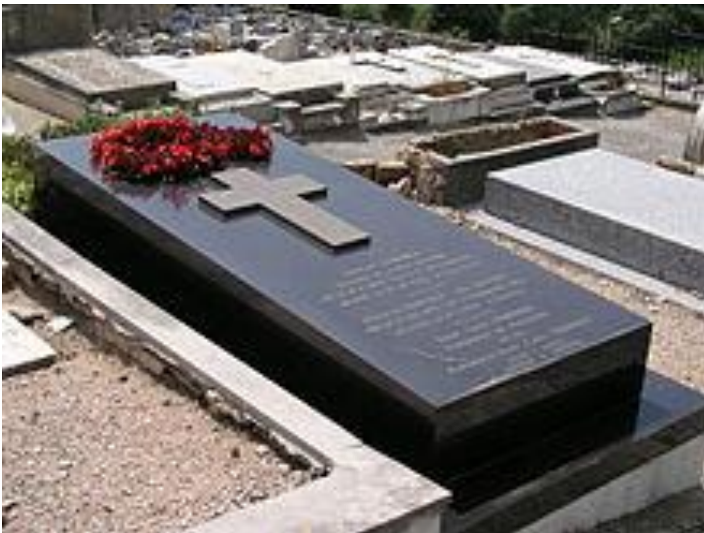
Могила Фаберже в Каннах, на кладбище Гран-Жас