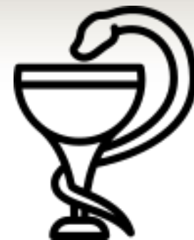
«Чаша Гигиен »

В современном мире наибольшее символическое значение для обозначения медицины получили четыре варианта: «Звезда жизни», «Посох Асклепия», «Эмблема IFRC», «Чаша Гигиен».