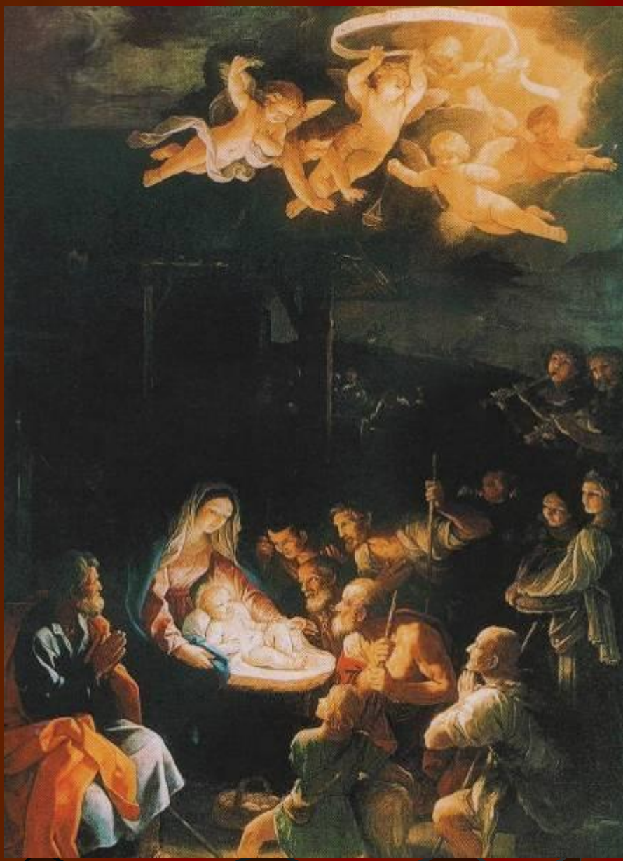
Гвидо Рени. Поклонение пастухов. Около 1640