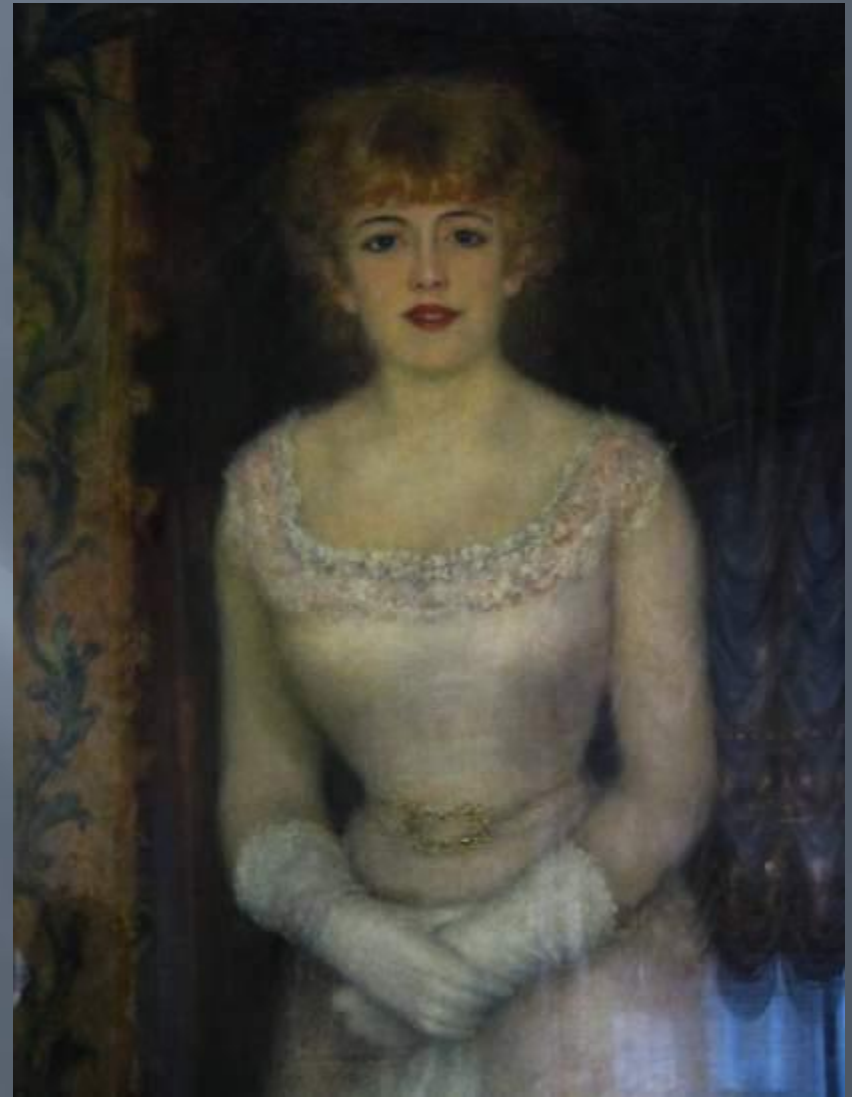
Портрет актрисы Жанны Самари (1878, Государственный Эрмитаж)