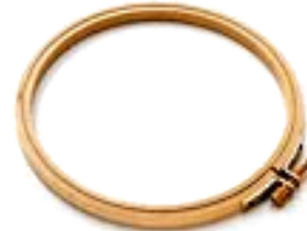
деревянные пяльцы с металлическим винтом