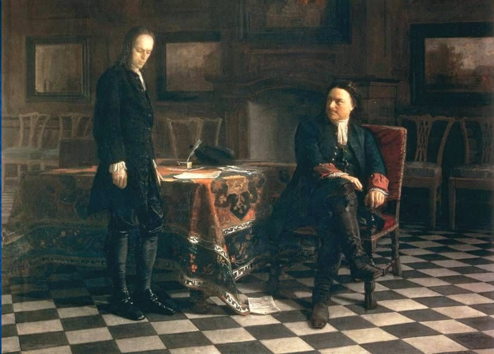
Петр I допрашивает царевича Алексея Петровича в Петергофе