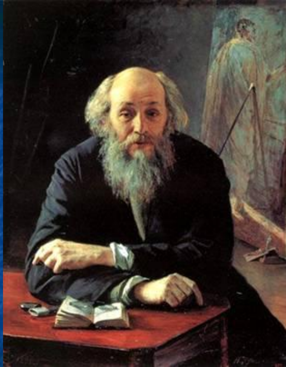
Н. Н. Ге