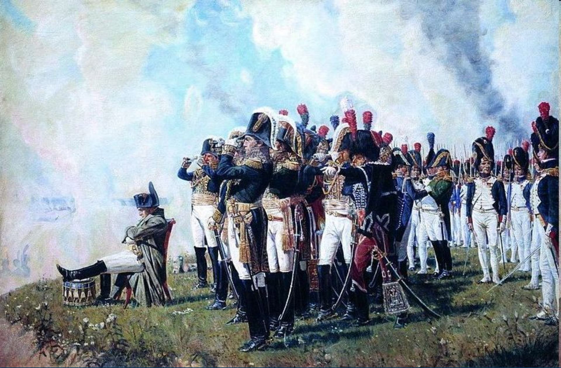
Наполеон I на Бородинских высотах