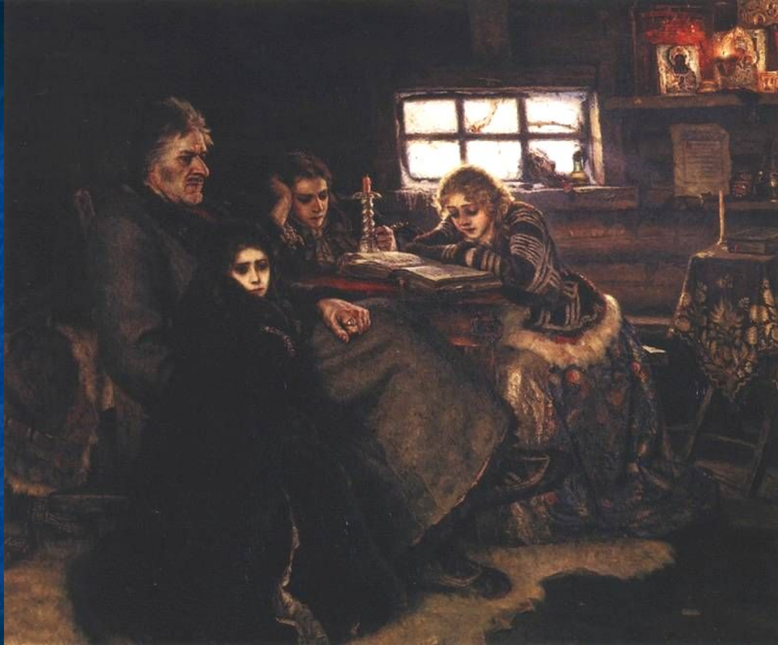
Меншиков в Березове