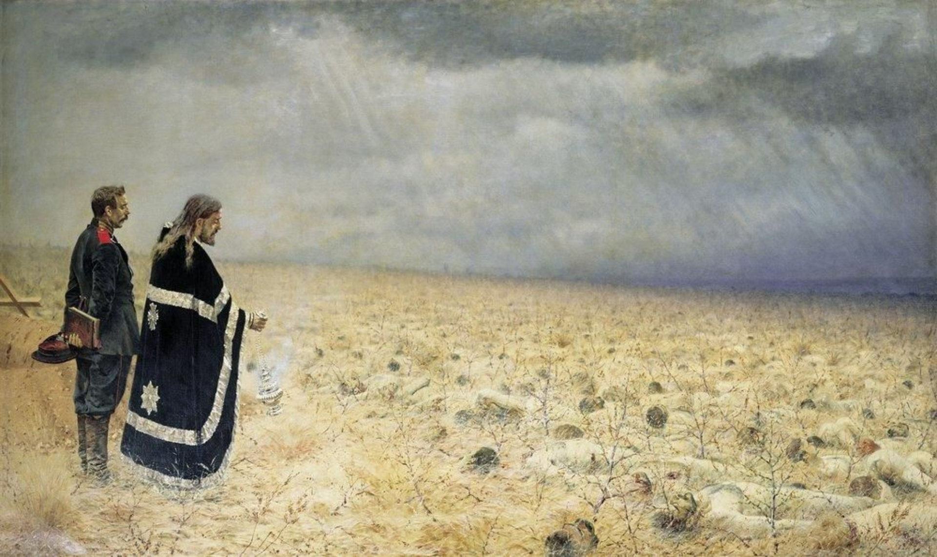
Побежденные. Панихида по павшим воинам