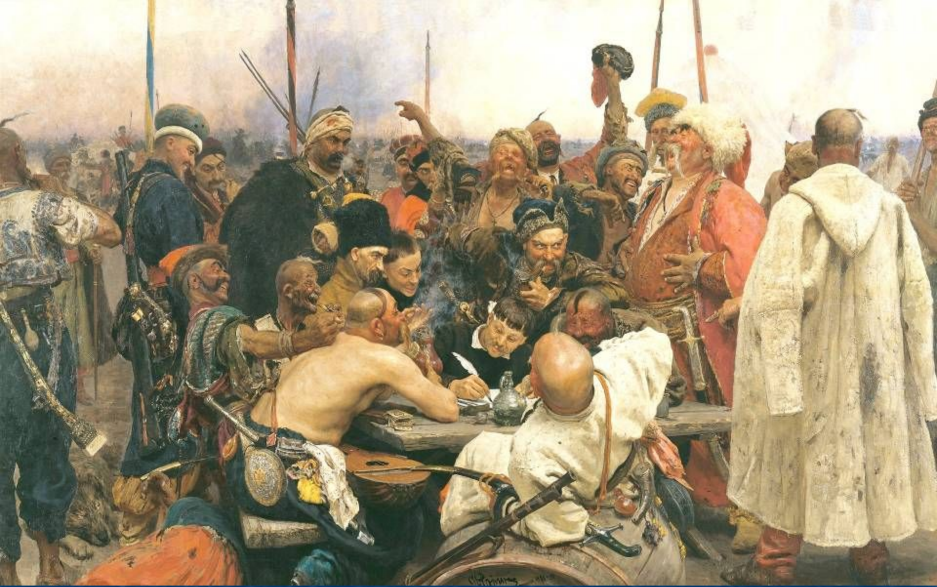
Запорожцы пишут письмо турецкому султану