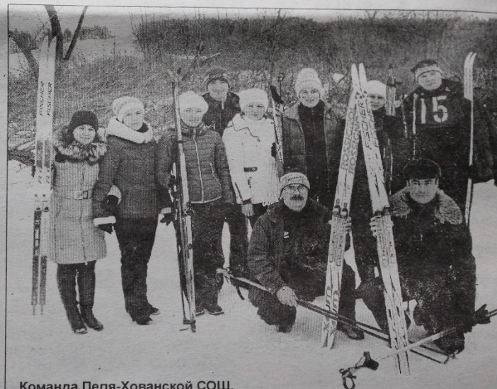
Команда Пеля-Хованской СОШ.