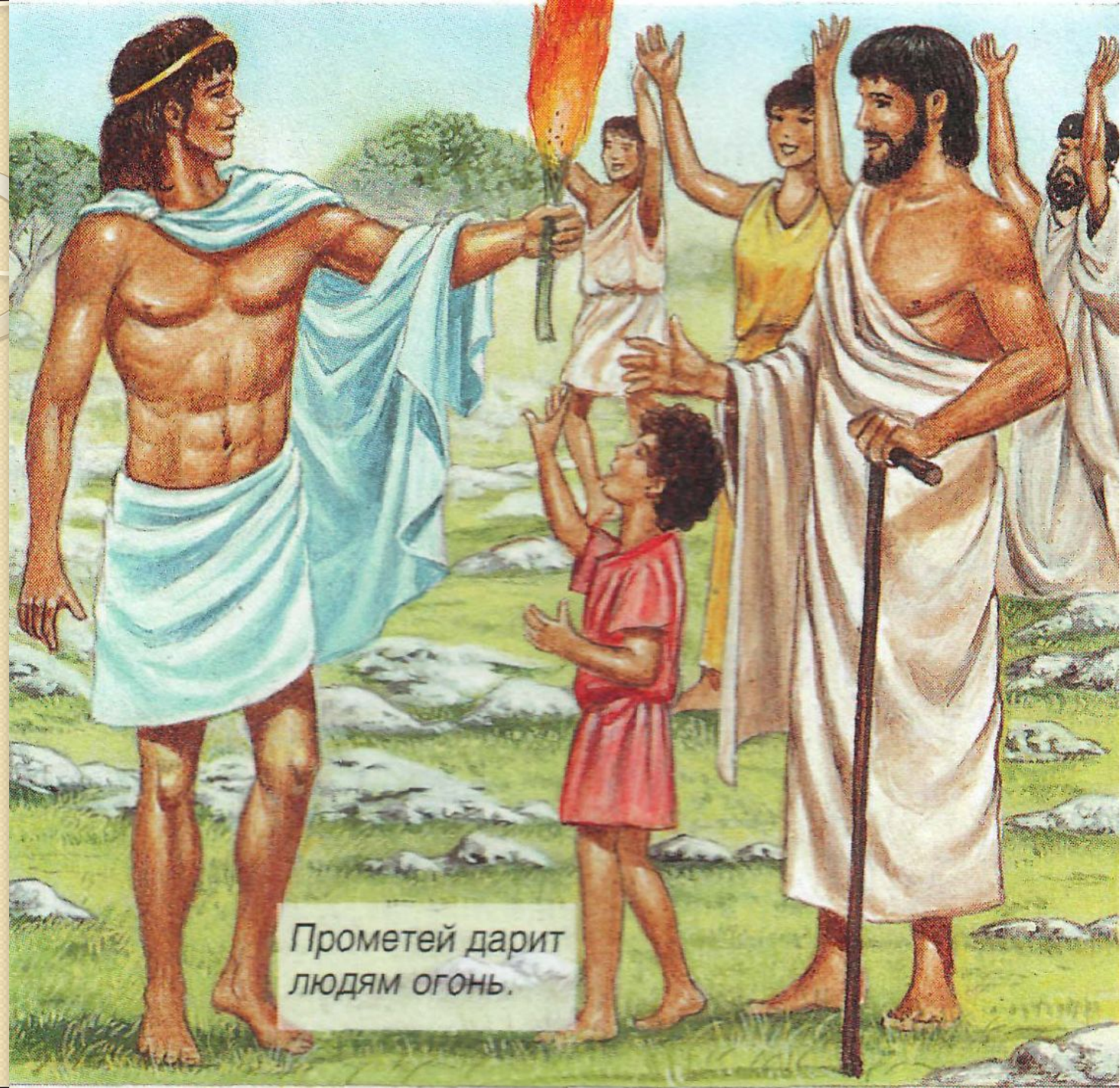
Прометей дарит людям огонь.