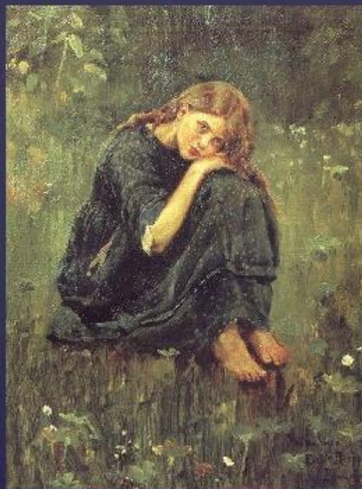
Этюд к картине Виктора Васнецова «Алёнушка»

этюд – это небольшая работа, выполненная с натуры, в музыке – упражнение, нацеленное на развитие исполнительской техники и композиционного мастерства, в философии – размышление, исследование одного вопроса, узкой темы.