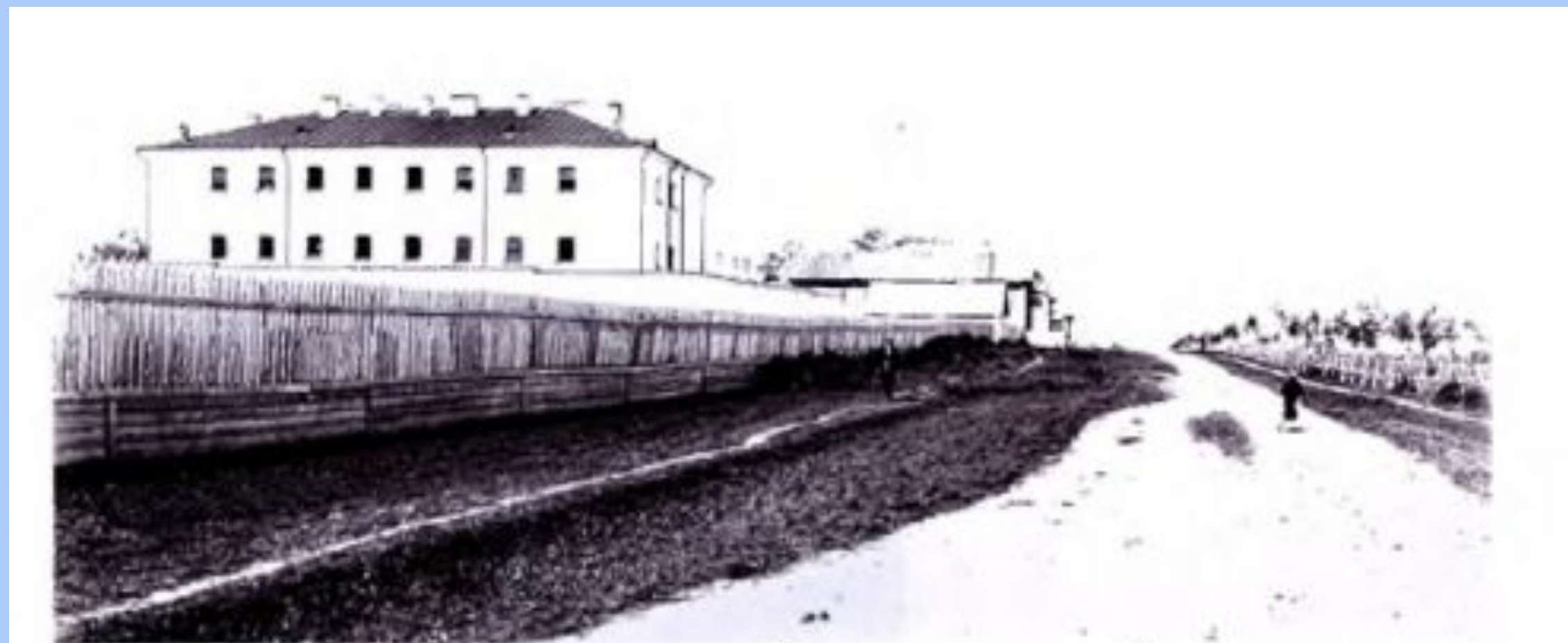
Городская тюрьма. Вид с севера-востока. Видны купола домово́й церкви и звонницы.