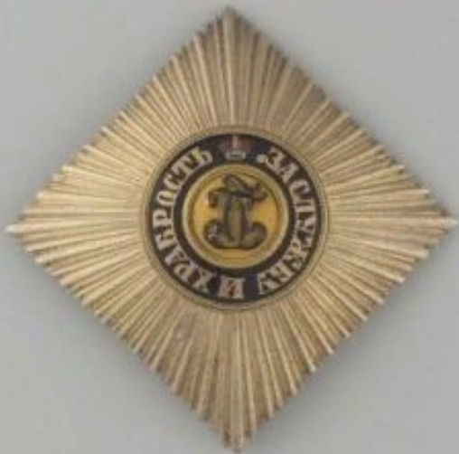
Звезда Крдену Св. Георгия