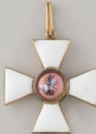
Знак 3-й степени