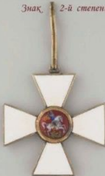
Знак 2-й степени