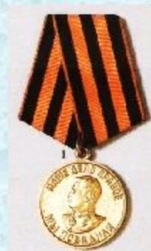
Медаль «За Победу над Германией»