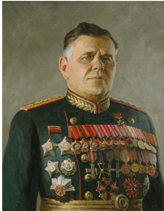
А. И. Еременко

Слайд 2. Крымская наступательная операция войск 4-го Украинского фронта (командующий генерал армии Ф. И. Толбухин) и Отдельной Приморской армии (генерал армии А. И. Еременко).