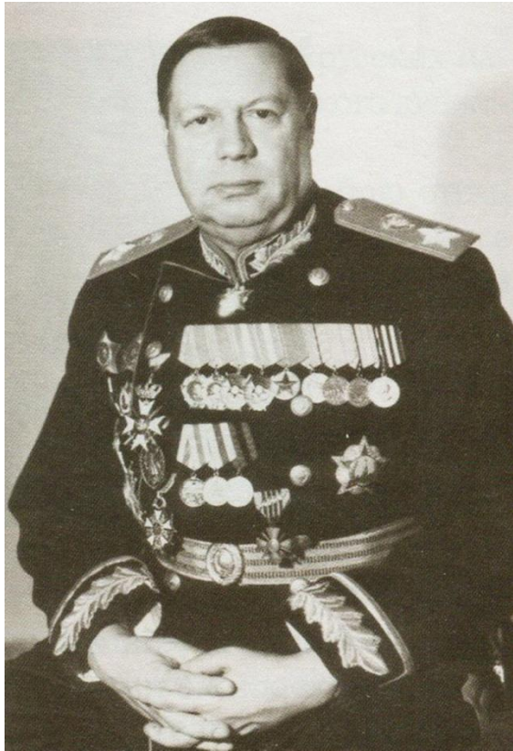
Ф. И. Толбухин