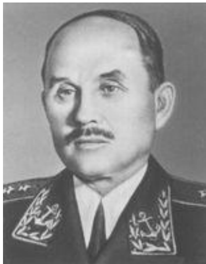
Ф. С. Октябрьский

Слайд 3. Во взаимодействии с Черноморским флотом (адмирал Ф. С. Октябрьский) и Азовской военной флотилией (контр-адмирал С. Г. Горшков) 8 апреля - 12 мая с целью освобождения Крыма от немецко-фашистских войск во время Великой Отечественной войны 1941/45. В результате Мелитопольской операции 26 сентября - 5 ноября 1943 и Керченско-Эльтигенской десантной операции 31 октября - 11 ноября 1943 советские войска прорвали укрепления Турецкого вала на Перекопском перешейке и захватили плацдармы на южном берегу Сиваша и на Керченском полуострове, но освободить в это время Крым им не удалось из-за недостатка сил.