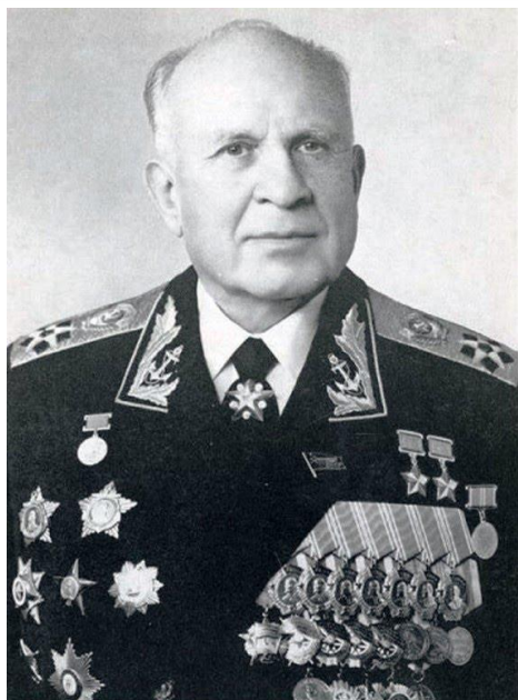
С. Г. Горшков