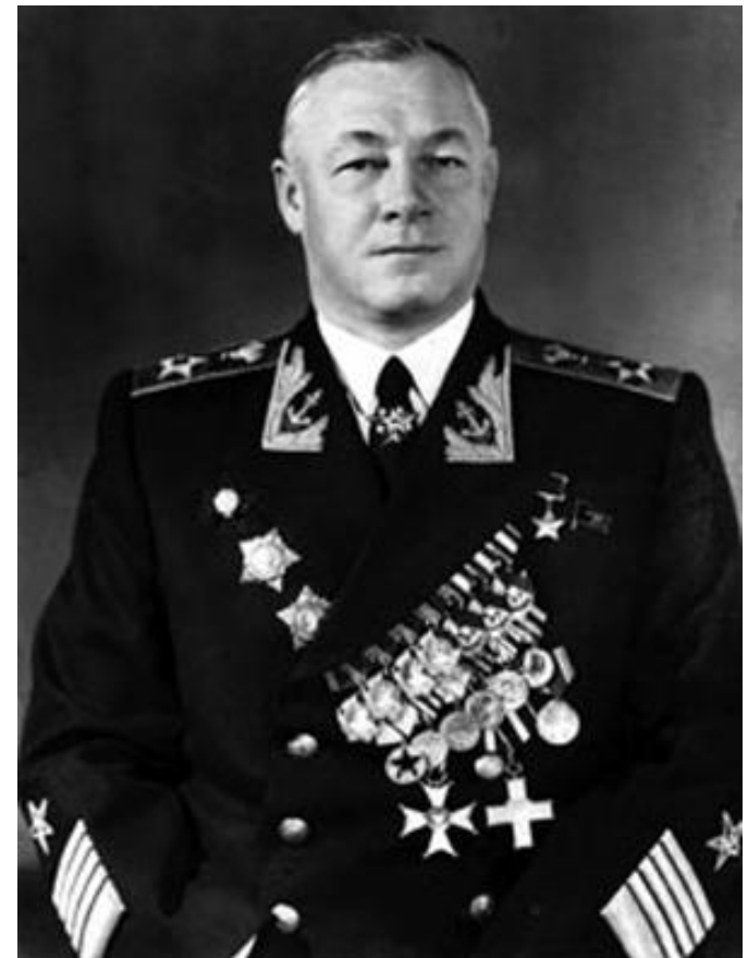
Адмирал Кузнецов Николай Герасимович

Овладение Крымом для Германии означало возможность контролировать Черное и Азовское моря, приблизиться к нефтеносным районам Кавказа и оказывать постоянное политическое давление на Румынию, Турцию и Болгарию