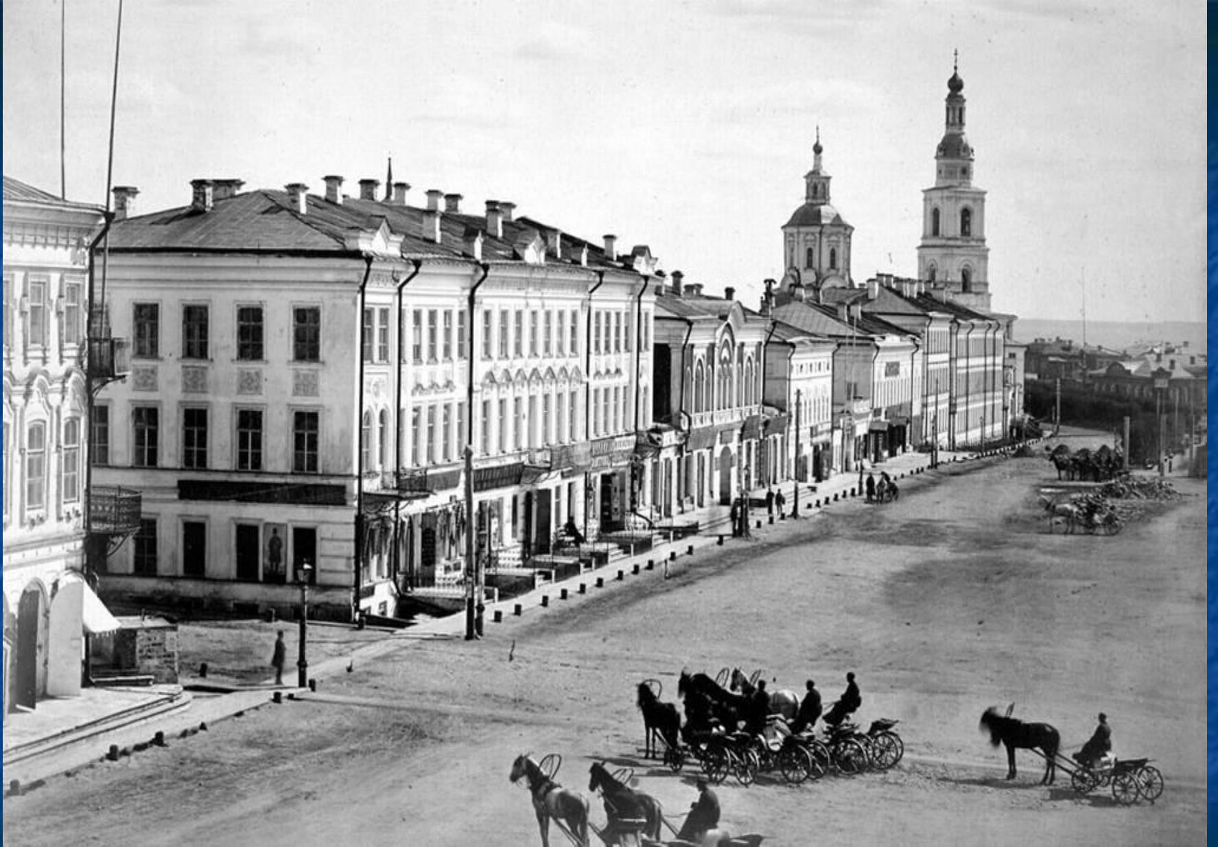
Симбирск в 19 веке