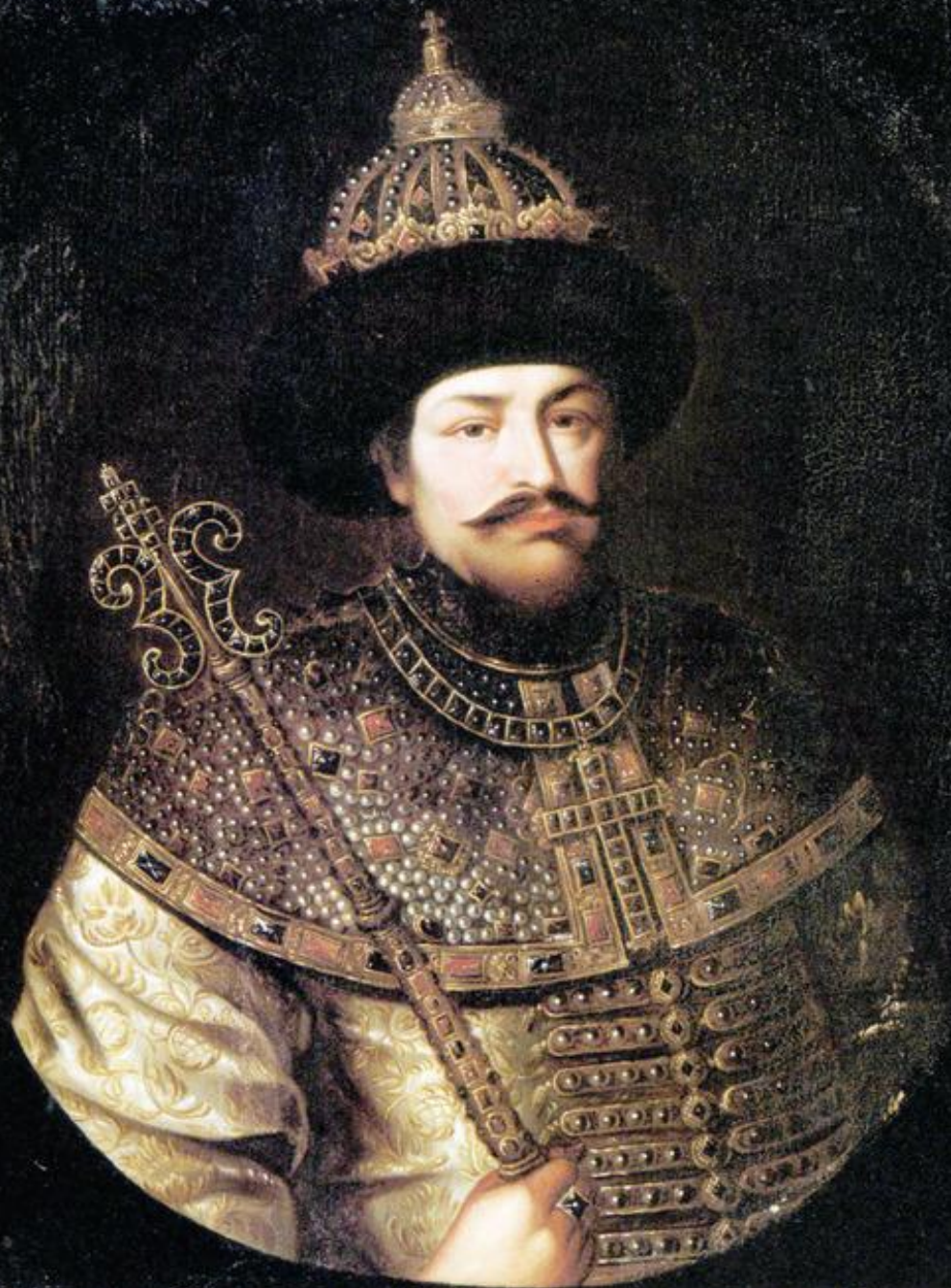
Алексей Михайлович Романов 1629-1676, русский царь с 1645 года