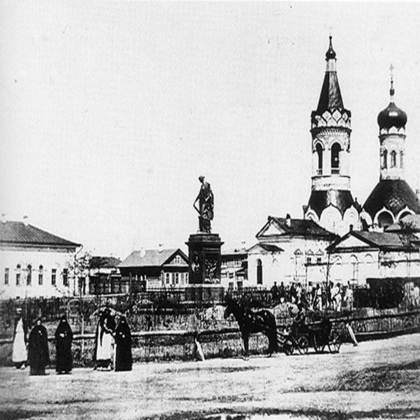
Симбирск в 19-начале 20 века