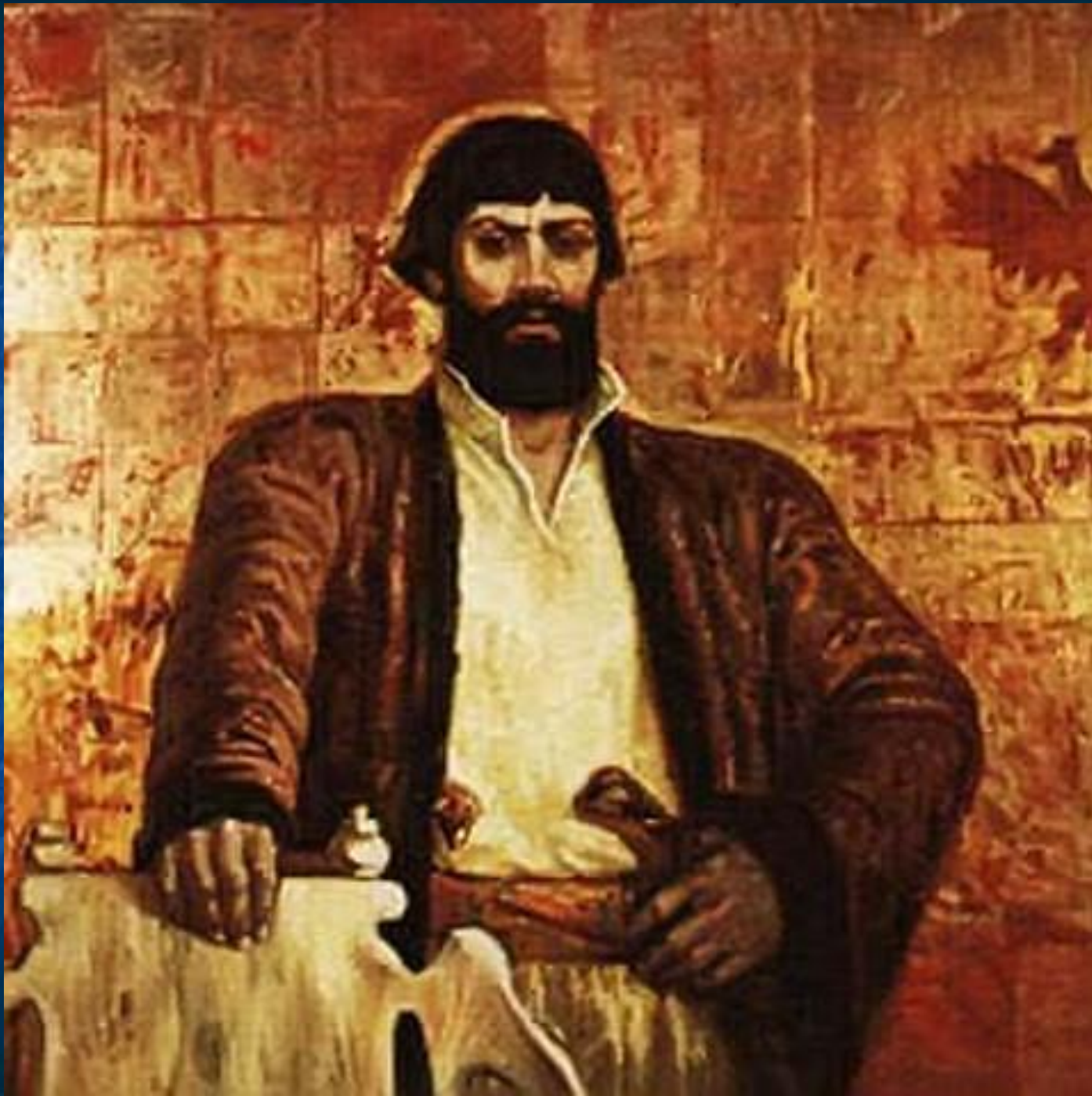
Предводитель крестьянской войны Емельян Иванович Пугачев 1740-1775