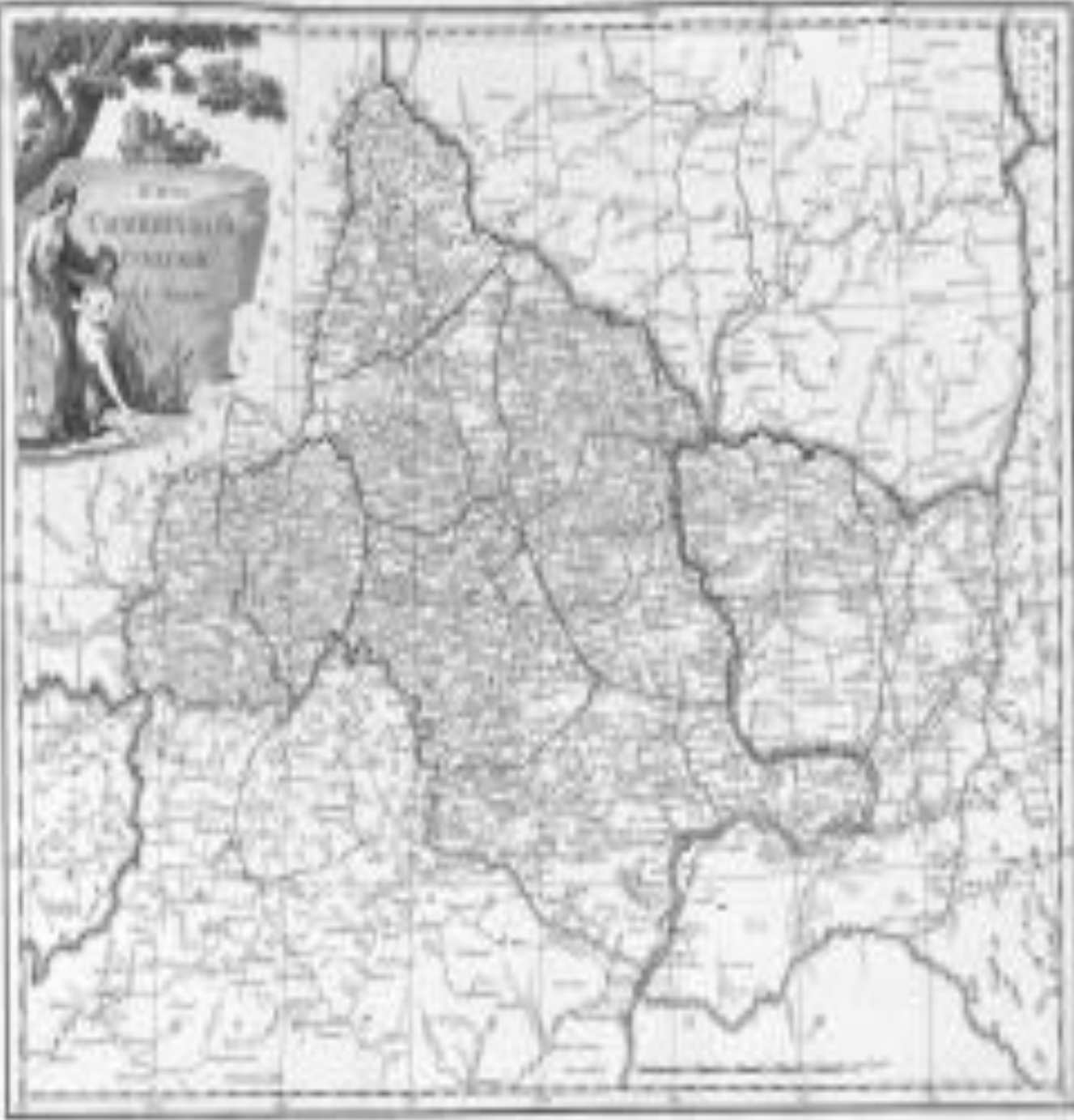
Карта Симбирской губернии, образованной по указу императора Павла Петровича Романова в 1796 году