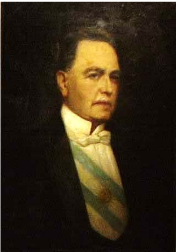
Иполито Иригойен, президент Аргентины в 1916-1922, 1928-1930 гг. от партии радикалов