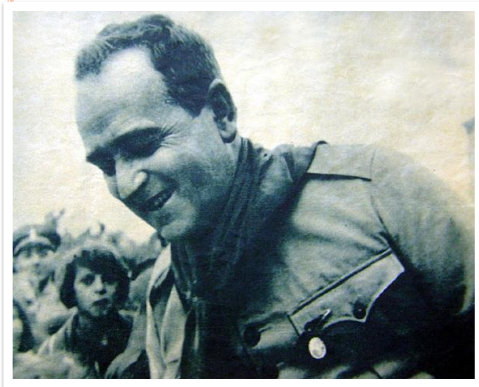
Жетулиу Варгас в ноябре 1930 года

1930 г. – военный переворот, президентом становится Ж.Варгас